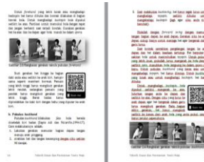
Gambar 2. Produk Bahan Ajar Berbasis Qr Code

pembelajaran, peraturan permainan dan tes keterampilan tenis meja. Berikut contoh produk :