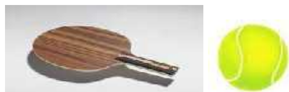
Gambar.2 Pemukul Kasti modifikasi dan bola lunak

Alat pemukul adalah kayu (bukan logam) yang bentuknya persegi panjang yang panjangnya 70 Cm dengan lebar bidang untuk memukul bola adalah 10 Cm sedangkan tebal kayu pegangan 2 Cm. Bola yang digunakan adalah bola lunak (bola tonnis).