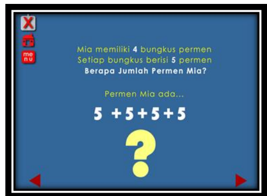
Gambar 1.4 Materi produk akhir