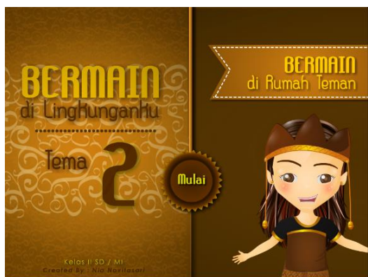
Gambar 1.1 Tampilan utama produk akhir

Berikut ini adalah tampilan dari prodak akhir multimedia interaktif tema 2, subtema 2 bermain dirumah teman, pembelajaran 4.