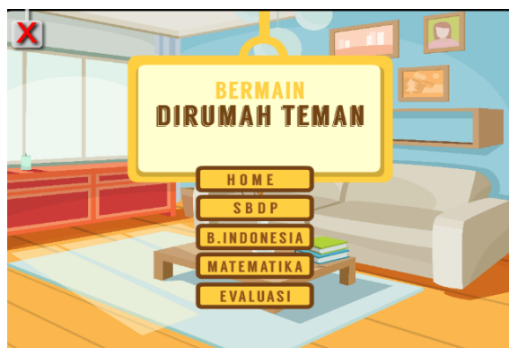
Gambar 1.2 Menu utama produk akhir