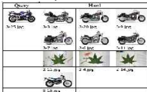
Tabel 5. Hasil Ujicoba dataset UW