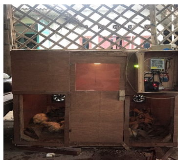
Gambar 1. aplikasi alat pada kandang

Penelitian ini menghasilkan sebuah produk berupa sistem pengatur suhu otomatis pada kandang ayam berbasis Internet of Things (IoT) . Sistem ini dirancang untuk menjaga suhu kandang tetap stabil secara otomatis sesuai dengan ambang batas yang telah ditentukan. Dalam proses perakitan dan pemrogramannya, sistem ini mengintegrasikan berbagai komponen elektronik yang saling terhubung dan dikendalikan oleh mikrokontroler. Tujuan utamanya adalah menciptakan solusi yang praktis dan efisien bagi peternak agar dapat memantau dan mengendalikan suhu kandang tanpa harus selalu berada di lokasi.