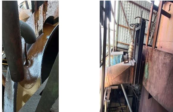
Gambar 5 . Aliran Massecuite

Massecuite yang terendam di bawa tabung Mono Vertical Crystallizer disodot oleh pipa naik ke atas, di bak penampung di samping tabung atas mengalir ke pipa samping menuju ke LGF.