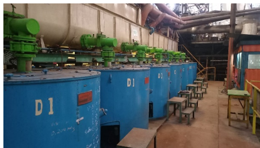
Gambar 6. Alat LGF ( Low Grade Centrivugal )

Massecuite yang terendam di bawa tabung Mono Vertical Crystallizer disodot oleh pipa naik ke atas, di bak penampung di samping tabung atas mengalir ke pipa samping menuju ke LGF.