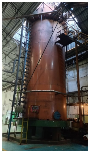
Gambar 1. Tampak Depan Mono Vertical Crystallizer

Proses kristalisasi gula di Pabrik Gula PG Djombang Baru melibatkan penggunaan alat Mono Vertical Crystallizer yang ditambahkan pada palung pendingin. Alat ini meningkatkan efisiensi proses dengan mampu menampung banyak koil dan mempercepat transfer panas, sehingga menghasilkan kristal gula yang lebih optimal. Dengan penerapan Mono Vertical Crystallizer, waktu pendinginan menjadi lebih efisien, mana masecuite dapat berada dalam alat ini selama kurang lebih 4 jam. Proses menyalakan yang dilakukan secara bertahap dengan aliran udara dingin yang efisien memberikan kontribusi pada penurunan suhu nira secara optimal. Keunggulan alat ini tidak hanya terletak pada efisiensi pendinginan, tetapi juga pada peningkatan kualitas udara sebelum memproses lebih lanjut. Dengan demikian, penggunaan Mono Vertical Crystallizer diharapkan dapat menghasilkan gula berkualitas tinggi dan meningkatkan produktivitas pabrik secara keseluruhan. Implementasi alat ini juga mencerminkan upaya pabrik untuk beradaptasi dengan teknologi terbaru dalam industri pengolahan gula, yang pada pasangannya dapat memberikan keuntungan kompetitif di pasar. Berikut kami sertakan visual gambar dan desainnya :