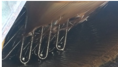
Gambar 4 . Gambaran Pipa di dalam yang berisi aliran air dingin.

mempengaruhi struktur kristal, mempertahankan kecepatan pendinginan yang optimal, dan mengurangi risiko pematatan prematur pada massa.