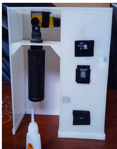
Gambar 3. Alat Otomatisasi Hand Sanitizer