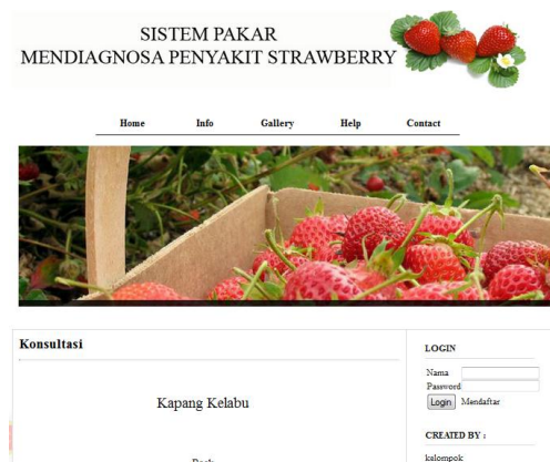
Gambar 5. Tampilan Hasil Diagnosa

Gambar 4 menunjukkan tampilan konsultasi. Jawab setiap pertanyaan yang diajukan dengan memilih ”YA” atau ”TIDAK”.