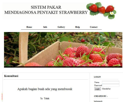
Gambar 4. Tampilan konsultasi

Gambar 4 menunjukkan tampilan konsultasi. Jawab setiap pertanyaan yang diajukan dengan memilih ”YA” atau ”TIDAK”.