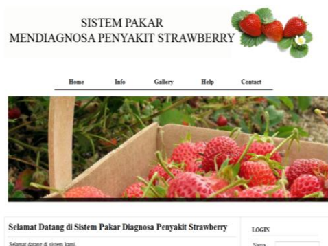
Gambar 3. Tampilan Awal Aplikasi

Tampilan awal saat aplikasi dijalankan terlihat pada gambar 3.