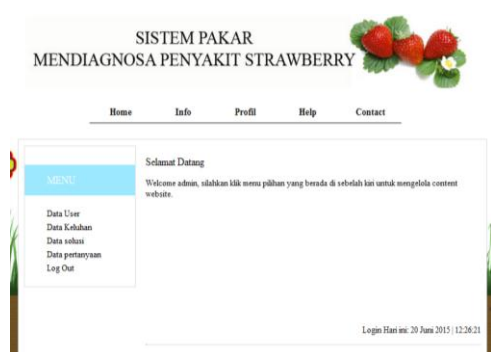
Gambar 6. Tampilan halaman Admin

Gambar 6 adalah tampilan halaman admin yang berisi menu Data User, Data Keluhan, Data Solusi, Data Pertanyaan dan Logout.