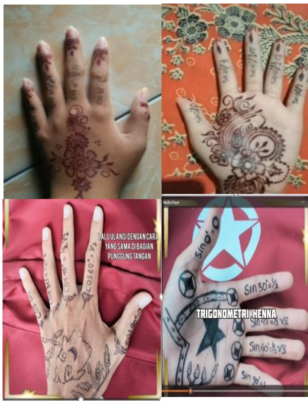
Gambar 3. contoh bentuk alat peraga “ Memorize Trigonometri Fingers ”

Alat peraga yang bernama “ Memorize Trigonometri Fingers ” adalah alat peraga yang memanfaatkan jari tangan manusia yang dihiasi atau dilukis dengan henna, alat tulis, aeliner, atau cat. Nilai sinus dan cosinus dengan sudut istimewa di kuadran I disisipkan dalam hiasan tersebut sehingga memudahkan siswa untuk menghafal (menguatkan ingatan).