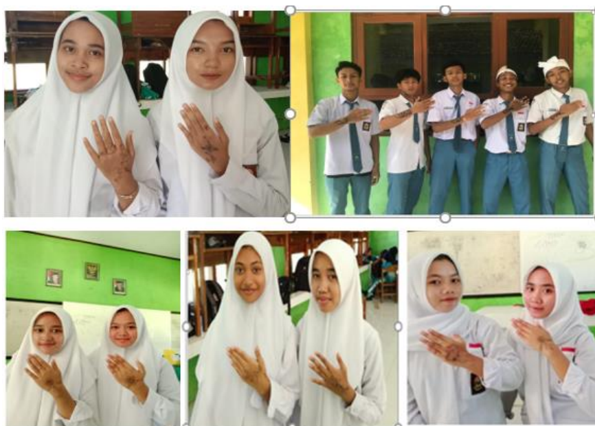
Gambar 2. siswa – siswi sedang menunjukkan lukisan ditangan

Berawal dari seringnya peneliti mengamati jari lengan siswa yang ada lukisannya, maka timbullah ide untuk membuat alat peraga yang memanfaatkan jari tangan manusia yang dihiasi atau dilukis dengan henna, alat tulis, eyeliner, atau cat. Rumus sinus dan cosinus dengan sudut istimewa di kuadran I disisipkan dalam hiasan tersebut sehingga memudahkan siswa dalam menghafal. Maka terciptalah alat peraga Memorize Trigonometri Fingers . Inilah dokumentasi siswa-siswa SMA Negeri 1 Ngronggot yang gemar melukis di jari tangannya.