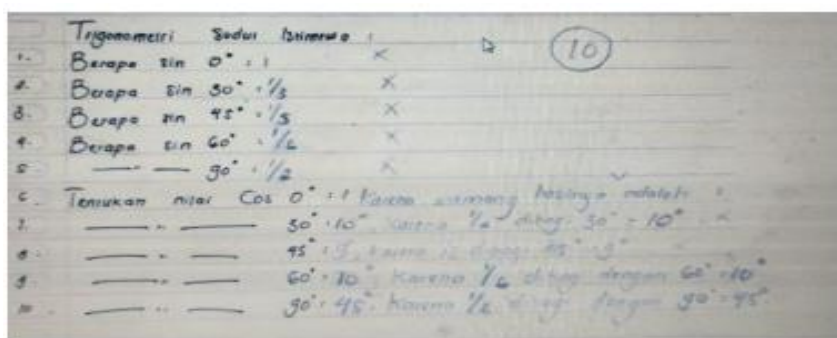
Gambar 1 Hasil Jawaban Siswa

Trisanti et al (2022), materi Trigonometri dianggap sulit, hal ini dialami oleh siswa SMAN 1 Ngronggot Nganjuk pada saat. siswa diminta untuk menentukan nilai \sin 0^\circ , \sin 30^\circ , \sin 45^\circ , \sin 60^\circ , \sin 90^\circ , \cos 0^\circ , \cos 30^\circ , \cos 45^\circ , \cos 60^\circ dan \cos 90^\circ , namun ada siswa yang hanya bisa menentukan nilai \cos 0^\circ dengan tepat (sebagaimana Gambar 1).