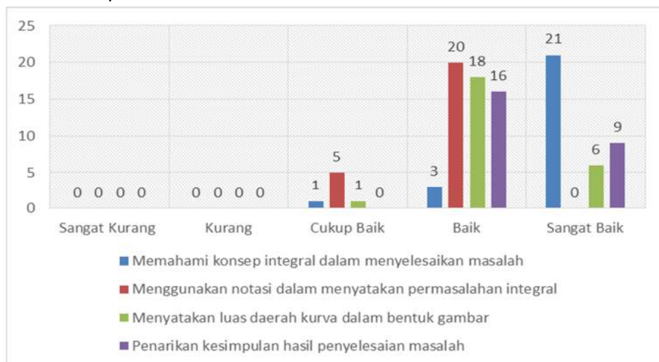
Gambar 2 Grafik Kemampuan Komunikasi Matematika Secara Tertulis Menggunakan Media Maple

Sedangkan hasil tes komunikasi matematika secara tertulis pada materi intergral menggunakan media maple .