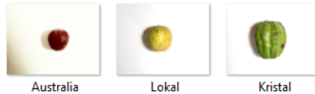
Gambar 2. Jenis-jenis jambu yang digunakan

yang dilakukan yaitu mengubah ulang ukuran pada citra dan memisahkan background dengan objek. Kemudian dilakukan Cropping gambar menjadi 640x480 piksel.