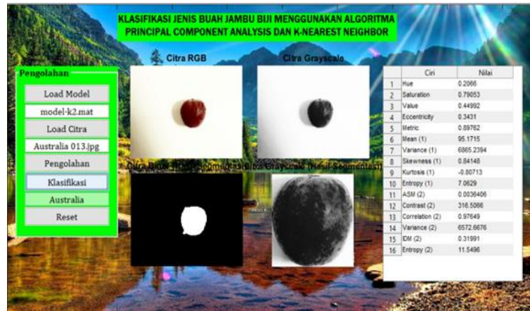
Gambar 6. Interface Program

Setelah diperoleh K-NN dari hasil training, selanjutnya dilakukan pengujian pada seluruh data testing yang telah disiapkan. Pengujian ini menggunakan 4 citra pada 3 jenis jambu biji. Data berjumlah 45 citra untuk menguji jenis jambu biji berdasarkan warna, bentuk dan tekstur menggunakan Principal Component Analysis dengan klasifikasi K-NN.