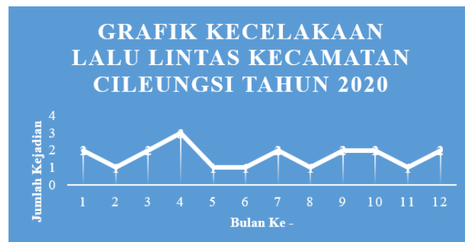
Gambar 2. Grafik Kecelakaan Lalu Lintas Kecamatan Cileungsi Tahun 2020