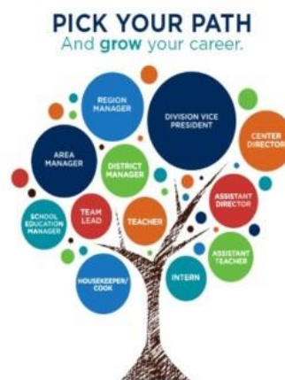
Gambar 1.

Berbagai pendekatan diberikan untuk melihat tingkat kematangan siswa dalam memahami pilihan karirnya. Aplikasi dalam Konseling dilakukan secara komprehensif setelah dewasa, melalui arahan guru Bk. Perjalanan karir seseorang ke depan ( Pick your Path and grow your career ) membawa siswa untuk menentukan pilihan dan bagaimana ia harus mengembangkan karirnya sesuai dengan kemampuan dan kepribadian. Berikut gambaran pohon karir berdasarkan sumber :