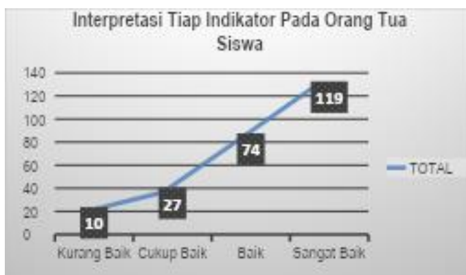
Gambar 1 Diagram Pie Interpretasi Tiap Indikator Pada Orang Tua Siswa

Berdasarkan diagram pie dan grafik diatas didapatkan data bahwa sebagian besar responden dari orang tua siswa memiliki perkembangan pembiasaan yang nyata pada AUD dari 23 siswa, sangat baik (52%), baik (32%), cukup baik (12%), dan kurang baik (4%). Dalam analisis kuesioner orang tua siswa di TK Pembina UMP yang di sajikan dalam diagram pie dan grafik distribusi responden pada orang tua siswa berdasarkan penerapan terkategoris baik pada AUD di rumah.