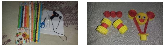
Gambar 1 : Media Tasru

Dengan demikian, guru menjadi kurang kreatif dan sangat monoton dalam melaksanakan pembelajaran motorik halus sehingga anak kurang tertarik dan mudah merasa bosan dengan kegiatan yang diberikan. Dari penjelasan di atas, penulis memilih pembelajaran bermain dengan media Tasru (Kertas Kokoru) guna untuk mengembangkan motorik halus anak. Salah satu alternatif bermain dengan media Tasru (Kertas Kokoru), Suryani (2014) menjelaskan bahwa kokoru merupakan kertas bergelombang yang memiliki aneka warna sehingga anak tidak akan merasa bosan dalam pembelajaran. Kertas kokoru merupakan bahan yang ramah lingkungan dan juga sangat aman untuk dijadikan media dalam bermain untuk anak. Dalam bermain dengan media Tasru (Kertas Kokoru) ini anak dapat belajar bagaimana cara menggulung, menggunting ataupun menempel kertas. Berdasarkan uraian di atas, maka dapat dirumuskan judul sebagai berikut, "Bermain Dengan Media Tasru (Kertas Kokoru) Untuk Mengembangkan Motorik Halus Anak".