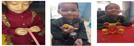
Gambar 2 Kegiatan anak pada siklus 1, 2, dan 3

menggulung pada anak usia 5- 6 tahun. Berikut bukti dokumentasi kegiatan bermain dengan media tasru (kertas kokoru) yang dilakukan anak didik kelompok B usia 5-6 tahun :