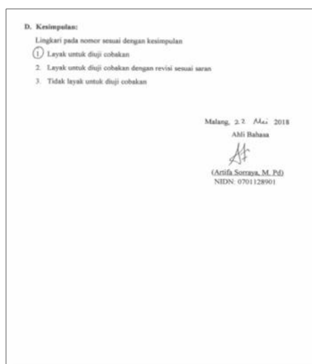
Gambar 7. Hasil Validasi Ahli Bahasa lembar ke 3

Kelayakan Aspek Bahasa Buku Ajar Staistika untuk pendidikan olahraga yang berjumlah 6 butir uji, terdapat 2 butir yang bernilai 4, dan 4 butir bernilai 3 sehingga total skor adalah (4x2) + (3x4) =20