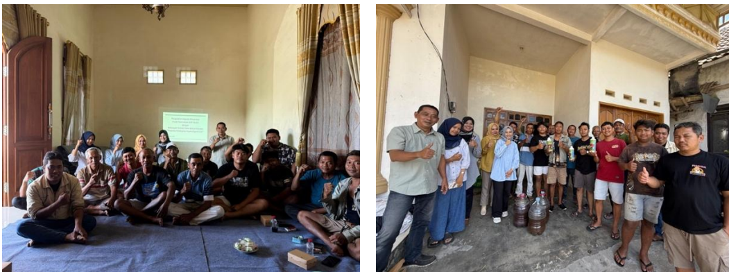
Gambar 3. Pemaparan materi Pupuk Organik Cair (kiri) foto bersama setelah praktik pembuatan Pupuk Organik Cair pada Kelompok Ternak Satria Kelud Perkasa di Desa Gadungan, Kecamatan Wates, Kabupaten Kediri (kanan).

Hasil pembuatan Pupuk Organik Cair menunjukkan bahwa 75% anggota kelompok ternak (15 orang) Satria Kelud Perkasa memiliki lahan pertanian dengan komoditas seperti padi, jagung, tebu, sayur-sayuran, dan buah-buahan. Karakteristik tanah di Desa Gadungan, Kecamatan Wates, Kabupaten Kediri umumnya bertekstur berpasir, merupakan wilayah pertanian tadah hujan tanpa irigasi teknis, dan secara umum kesuburan tanahnya tergolong sedang, meskipun menjadi lahan pertanian untuk berbagai komoditas tanaman seperti ubi jalar, jagung, dan tebu [8]. Kombinasi metode penyampaian materi, diskusi, kemudian dilakukan praktik langsung terbukti efektif