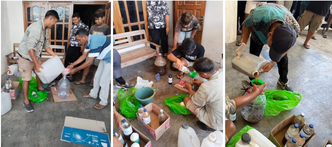
Gambar 2. Proses Pembuatan Pupuk Organik Cair kepada Kelompok Ternak Satria Kelud Perkasa di Desa Gadungan, Kecamatan Wates, Kabupaten Kediri.