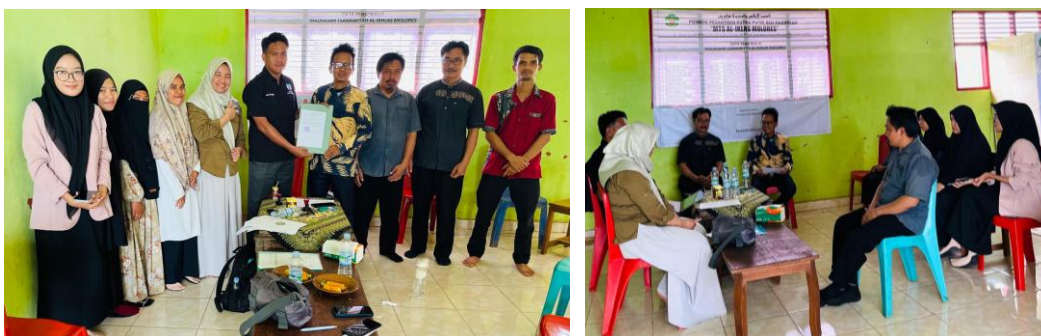
Gambar 1. Foto Kegiatan Visitasi

Pada aspek kualitas pembelajaran, indikator yang berkaitan dengan interaksi pendidik dan peserta didik, pengelolaan kelas, serta penerapan strategi pembelajaran kontekstual menunjukkan tingkat keterpenuhan yang tinggi. Pendidik mampu menciptakan lingkungan belajar yang kondusif, memberikan umpan balik positif, serta mengaitkan pembelajaran dengan konteks kehidupan nyata peserta didik. Kegiatan visitasi di MTSS Al-Ikhlas ditunjukkan pada Gambar 1.