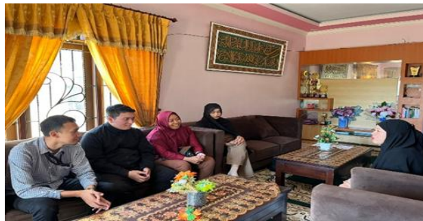
Gambar 3. Koordinasi Tim Pengabdian dengan Bu Lurah (Ketua PKK)

Produk Berbasis Teknologi Digital”. Langkah pertama yang kami lakukan adalah berkordinasi dengan ibu kades selaku ketua ibu PKK di Dusun Putukrejo. Kordinasi sangat diperlukan karena memilih peserta yang akan disertai tanggung jawab untuk membuat desain kemasan. Langkah selanjutnya, tim pengabdian melakukan diseminasi terkait pentingnya desain kemasan dan cara membuat desain kemasan yang informatif kepada seluruh ibu-ibu PKK di dusun Putukrejo. Langkah terakhir pada kegiatan ini adalah memberikan pelatihan serta pengenalan salah satu web desain yaitu Canva untuk membuat desain kemasan yang informatif dan menarik. Adapun dibawah ini merupakan langkah pertama yaitu koordinasi dengan ibu lurah.