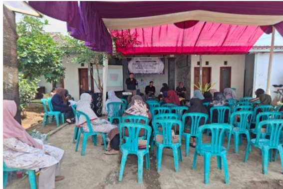
Gambar 4. Kegiatan Pelatihan Optimalisasi Pemasaran dan Kemasan Produk Berbasis Teknologi

Untuk merancang desain kemasan, tim pengabdian mengenalkan aplikasi canva. Canva merupakan salah satu platform online yang menawarkan berbagai alat pengeditan dalam membuat desain grafis yang mudah digunakan terutama bagi pengguna pemula. Aplikasi ini dapat diakses melalui smartphone maupun komputer, sehingga memberikan fleksibilitas dalam proses pembuatan desain [10]. Dalam kegiatan pendampingan ini perwakilan ibu-ibu PKK dusun Putukrejo sangatlah antusias. Hal tersebut dikarenakan ini aplikasi baru yang mereka tau terkait merancang desain. Aplikasi Canva selain bisa membuat label produk, bisa juga digunakan untuk membuat rancangan undangan kegiatan PKK.