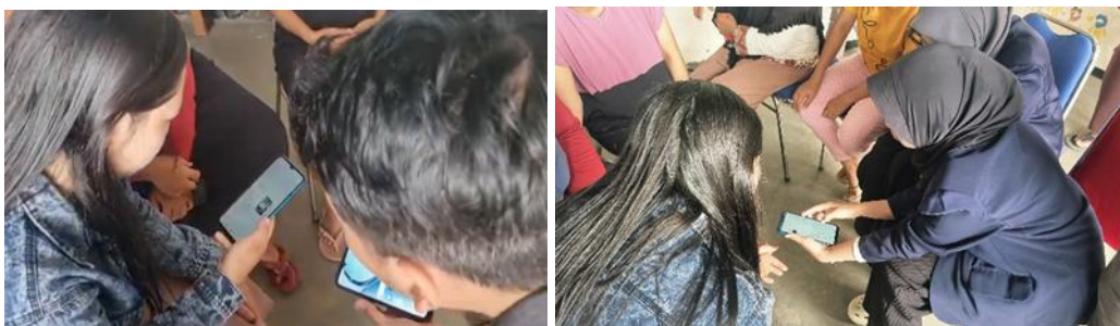
Gambar 5. Pendampingan antara ibu PKK dengan Tim Pengabdian dalam Merancang Desain

Untuk merancang desain kemasan, tim pengabdian mengenalkan aplikasi canva. Canva merupakan salah satu platform online yang menawarkan berbagai alat pengeditan dalam membuat desain grafis yang mudah digunakan terutama bagi pengguna pemula. Aplikasi ini dapat diakses melalui smartphone maupun komputer, sehingga memberikan fleksibilitas dalam proses pembuatan desain [10]. Dalam kegiatan pendampingan ini perwakilan ibu-ibu PKK dusun Putukrejo sangatlah antusias. Hal tersebut dikarenakan ini aplikasi baru yang mereka tau terkait merancang desain. Aplikasi Canva selain bisa membuat label produk, bisa juga digunakan untuk membuat rancangan undangan kegiatan PKK.