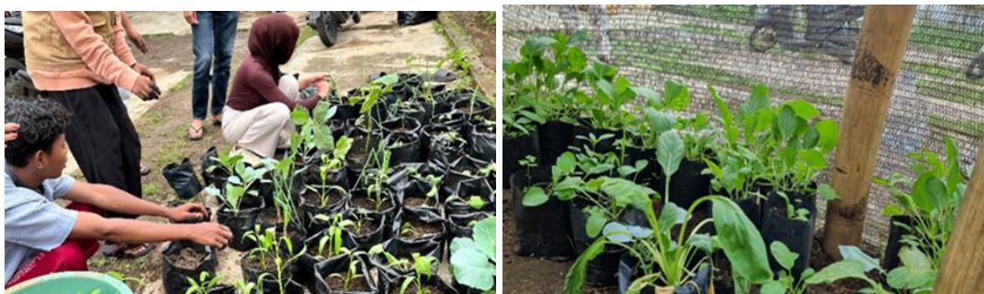
Gambar 1. Pembibitan Di Dusun Putukrejo oleh Masyarakat Sekitar

Pemberdayaan dimaknai sebagai upaya menyiapkan kepada masyarakat terkait sumber daya, pengetahuan, kesempatan dan keahlian untuk meningkatkan kapasitas diri masyarakat di dalam menentukan masa depan mereka, serta berpartisipasi dan memengaruhi kehidupan dalam komunikasi masyarakat tersebut. Hakikat pemberdayaan adalah bagaimana membuat masyarakat mampu memperbaiki kondisinya sendiri dan mampu pula membangun dirinya [2]. Pemberdayaan masyarakat dapat dimaknai dari beberapa perspektif. Pertama, pemberdayaan dimaknai dalam konteks menempatkan posisi masyarakat. Kedua, titik tumpu pemberdayaan terdapat pada kekuasaan (power), yang merupakan jawaban atas ketidakberdayaan (powerless) masyarakat. Ketiga, pemberdayaan terbentang dari proses sampai visi ideal. Keempat, pemberdayaan masyarakat terdiri dari level psikologis personal anggota masyarakat hingga pada level struktural masyarakat keseluruhan.