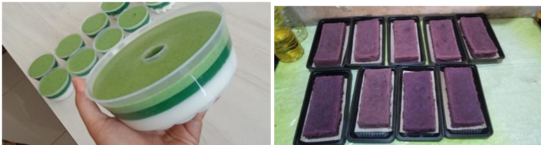
Gambar 2. Produk Olahan Ibu-ibu PKK dari Produk Pertanian yang dihasilkan

Melihat nilai manfaat yang tinggi dari hasil tanaman yang di panen oleh ibu-ibu PKK dusun Putukrejo maka ibu-ibu tersebut melakukan inovasi produk. Ada beberapa inovasi produk hasil olahan dari kelompok ibu PKK di dusun Putukrejo mulai dari brownies terong, pudding susu sawi dan daun kelor. Kelompok ini memiliki potensi besar untuk meningkatkan jumlah produksi dan berencana memasarkan hasil panen ke pasar tradisional maupun swalayan di sekitar Kecamatan Wagir.