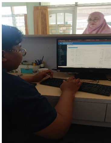
Gambar 1. Identifikasi proses bisnis dibantu Mahasiswa

Pelatihan pada pengabdian ini menggunakan analisa proses bisnis dengan Metode Failure Mode and Effect Analysis (FMEA). Metode FMEA digunakan untuk mencari nilai severity , occurency , dan detection yang nantinya akan menghasilkan nilai Risk Priority Number (RPN)[8]. Setelah mendapatkan nilai RPN tertinggi, maka selanjutnya akan dibuatkan rekomendasi proses bisnis dengan menggunakan Metode Business Process Improvement (BPI) [9].