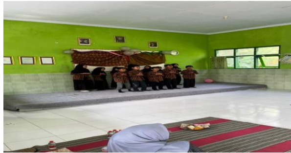
Gambar 11. Penampilan paduan suara kelas 3 dalam Gelar Nusantara

Setelah fashion show selesai, rangkaian acara dilanjutkan dengan penampilan menyanyi dari peserta didik kelas III yang membawakan lagu “Guruku Tersayang”. Penampilan ini disajikan dengan penuh penghayatan sebagai bentuk penghormatan dan apresiasi kepada guru. Peserta didik tampil secara berkelompok dengan pengaturan posisi yang rapi, serta didampingi iringan musik yang mendukung suasana haru dan penuh makna. Penampilan ini memberikan jeda yang tenang setelah fashion show, sekaligus menanamkan nilai karakter berupa rasa hormat dan terima kasih kepada pendidik.