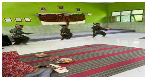
Gambar 13. Penampilan pencak silat kolaborasi kelas 4, 5, dan 6 dalam Gelar Nusantara

Selanjutnya, panggung Gelar Nusantara diisi dengan penampilan menyanyi lagu pop Jawa oleh peserta didik kelas IV. Pada sesi ini, peserta didik menampilkan lagu daerah berbahasa Jawa dengan memperhatikan pelafalan, intonasi, dan ekspresi yang sesuai. Penampilan ini menjadi wujud pengenalan dan pelestarian bahasa daerah sebagai bagian dari kekayaan budaya Nusantara. Suasana acara kembali hidup dengan irama lagu yang ceria dan familiar, serta mendapatkan apresiasi dari seluruh warga sekolah.