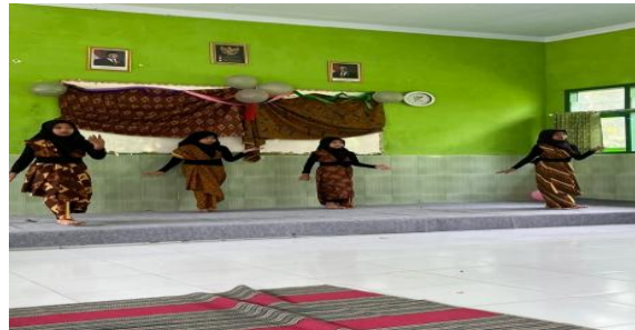
Gambar 14. Penampilan tari oleh kelas 5 dalam Gelar Nusantara

Rangkaian penampilan kemudian dilanjutkan dengan kolaborasi pencak silat yang melibatkan peserta didik kelas IV, V, dan VI. Penampilan ini disajikan dalam bentuk rangkaian gerakan dasar pencak silat yang disusun secara sederhana namun terkoordinasi. Peserta didik menampilkan gerakan dengan disiplin, kekompakan, dan ketepatan formasi, sehingga mencerminkan nilai sportivitas, keberanian, serta pengendalian diri. Kolaborasi lintas jenjang ini menunjukkan kerja sama yang baik antar peserta didik serta memperkuat nilai persatuan dalam keberagaman.