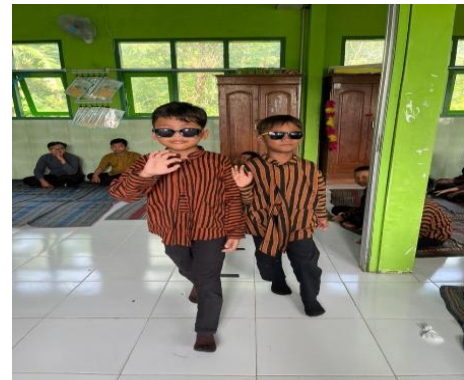
Gambar 10. Penampilan Fashion Show kelas 1 dan 2 dalam Gelar Nusantara

Rangkaian penampilan Gelar Nusantara dilaksanakan secara terstruktur dan berurutan agar seluruh kegiatan berjalan tertib serta memberikan pengalaman tampil yang nyaman bagi peserta didik. Penampilan dimulai dengan fashion show peserta didik kelas I dan kelas II sebagai pembuka acara. Pada sesi ini, peserta didik tampil mengenakan busana lurik yang dipadukan dengan berbagai aksesoris pribadi, seperti kacamata, bando, aksesoris rambut atau kepala, serta blangkon. Peserta didik berjalan secara bergantian di atas area panggung dengan iringan musik bernuansa Nusantara, menunjukkan ekspresi percaya diri dan kebanggaan terhadap busana yang dikenakan. Penampilan fashion show ini menjadi pembuka yang menarik sekaligus memperkenalkan nuansa budaya lokal kepada seluruh hadirin.