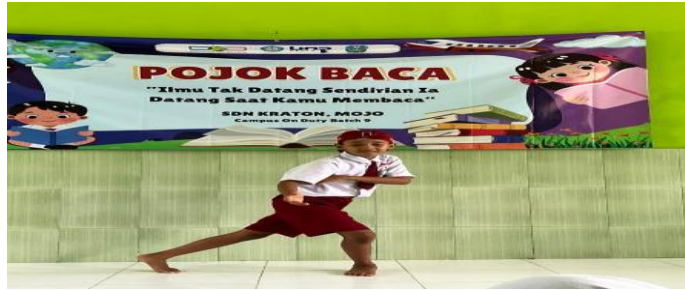
Gambar 6. Proses latihan pencak silat