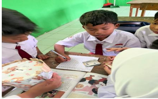
Gambar 2. Pelaksanaan kegiatan menabung

Setelah celengan selesai dibuat, kegiatan dilanjutkan dengan proses menabung secara rutin yang dilaksanakan selama periode 3 November hingga 4 Desember 2025. Dalam rentang waktu tersebut, peserta didik dibiasakan untuk menyisihkan sebagian uang saku mereka ke dalam celengan, baik secara harian maupun mingguan sesuai kesepakatan kelas. Proses menabung ini didampingi oleh guru dan mahasiswa, sehingga peserta didik tidak hanya menabung, tetapi juga memahami nilai uang, pentingnya konsistensi, serta kebiasaan mengatur keuangan sederhana. Kegiatan ini secara bertahap membentuk sikap disiplin, tanggung jawab, dan kesadaran finansial pada diri peserta didik.