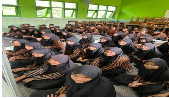
Gambar 9 Pelaksanaan kegiatan Gelar Nusantara dan CELENFEST di SDN Kraton

Tahap pelaksanaan puncak kegiatan CELENFEST dan Gelar Nusantara dilaksanakan pada 20 Desember 2025, mulai pukul 08.00 WIB hingga selesai, bertempat di SDN Kraton. Kegiatan bazar CELENFEST melibatkan peserta didik secara aktif sebagai penjual dan pembeli, sehingga mereka dapat mempraktikkan penggunaan modal hasil tabungan, melayani transaksi, serta menghitung pemasukan dan pengeluaran sederhana. Secara bersamaan, Gelar Nusantara menjadi wadah ekspresi budaya dan kreativitas peserta didik melalui berbagai pentas seni yang ditampilkan dengan penuh antusiasme dan percaya diri.