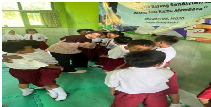
Gambar 8. Proses latihan fashion show

Proses latihan Gelar Nusantara dilaksanakan beberapa hari sebelum pelaksanaan kegiatan puncak dengan pendampingan mahasiswa dan guru. Latihan fashion show untuk kelas I dan II diawali dengan pengenalan makna kain lurik sebagai simbol kearifan lokal dan identitas budaya, dilanjutkan dengan latihan berjalan di atas panggung, pengaturan urutan tampil, serta pembiasaan sikap percaya diri saat mengenakan busana dan aksesoris pribadi. Latihan menyanyi untuk kelas III dan IV difokuskan pada penguasaan lirik, pelafalan, intonasi, tempo, serta ekspresi yang sesuai dengan makna lagu. Latihan tari untuk kelas V dilakukan secara bertahap mulai dari pengenalan gerakan dasar, penggabungan gerakan, penyesuaian dengan irama musik, hingga kekompakan kelompok. Sementara itu, latihan pencak silat dilaksanakan dengan menekankan kedisiplinan, ketepatan gerak, sinkronisasi formasi, serta pemahaman nilai sportivitas dan pengendalian diri sebagai bagian dari warisan budaya bangsa.