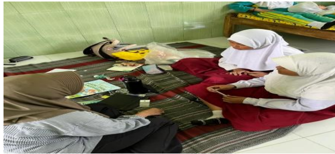
Gambar 7. Proses latihan menyanyi