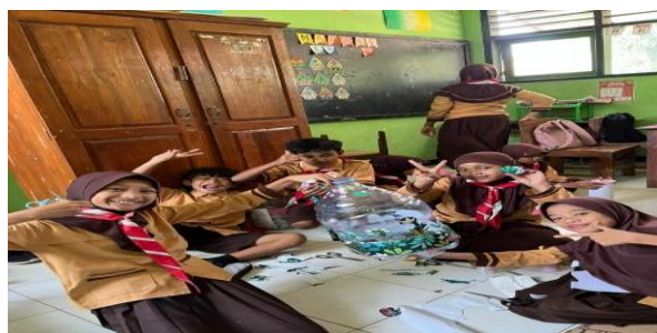
Gambar 1. Pembuatan tabungan

Secara keseluruhan, hasil evaluasi menunjukkan bahwa metode pelaksanaan program GELAR NUSANTARA dan CELENFEST berhasil menciptakan pembelajaran terpadu yang edukatif sekaligus menyenangkan. Peserta didik tidak hanya memperoleh pemahaman konsep literasi budaya dan finansial, tetapi juga mendapatkan pengalaman belajar bermakna yang memperkuat aspek sikap, keterampilan sosial, serta rasa kebersamaan. Temuan ini menjadi dasar untuk pengembangan dan replikasi program serupa di masa mendatang.