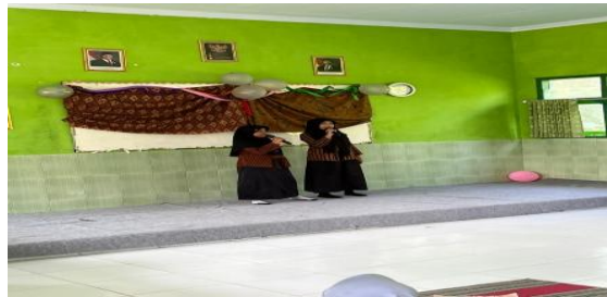
Gambar 12. Penampilan menyanyi lagu pop Jawa oleh kelas 4 dalam Gelar Nusantara

Setelah fashion show selesai, rangkaian acara dilanjutkan dengan penampilan menyanyi dari peserta didik kelas III yang membawakan lagu “Guruku Tersayang”. Penampilan ini disajikan dengan penuh penghayatan sebagai bentuk penghormatan dan apresiasi kepada guru. Peserta didik tampil secara berkelompok dengan pengaturan posisi yang rapi, serta didampingi iringan musik yang mendukung suasana haru dan penuh makna. Penampilan ini memberikan jeda yang tenang setelah fashion show, sekaligus menanamkan nilai karakter berupa rasa hormat dan terima kasih kepada pendidik.