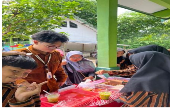
Gambar 4. Pelaksanaan bazar CELENFEST

Berdasarkan hasil tabungan yang telah dihitung dan didata, peserta didik kemudian diarahkan untuk merencanakan kegiatan bazar CELENFEST. Peserta didik berdiskusi secara berkelompok untuk menentukan jenis produk yang akan dijual dengan mempertimbangkan jumlah modal, minat, dan kebutuhan warga sekolah. Produk yang dipilih beragam, meliputi makanan dan minuman seperti es kul-kul, bola jeli, gorengan, pisang cokelat, basreng, bakso bakar, puding, es buah, es cappuccino cincau (es capcin), dan es kuwut. Selain itu, beberapa kelompok memilih menjual aksesoris sederhana seperti gelang dan cincin dari manik-manik. Mahasiswa pendamping juga turut berpartisipasi dengan membuka lapak aksesoris berupa gelang, jepit rambut, dan stiker sebagai contoh praktik kewirausahaan sederhana bagi peserta didik.