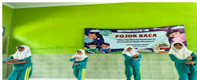
Gambar 5. Proses latihan menari

Seiring dengan persiapan bazar, tahap persiapan Gelar Nusantara juga dilaksanakan melalui penentuan jenis pentas seni yang akan ditampilkan oleh setiap jenjang kelas. Peserta didik kelas I dan II ditetapkan untuk menampilkan fashion show dengan mengenakan busana lurik yang dipadukan dengan aksesoris pribadi seperti kacamata, bando, aksesoris rambut atau kepala, blangkon, dan aksesoris pendukung lainnya. Kelas III menampilkan lagu “Guruku Tersayang”, kelas IV menampilkan lagu pop Jawa, kelas V menampilkan tarian daerah, serta kolaborasi pencak silat yang melibatkan peserta didik kelas IV, V, dan VI.