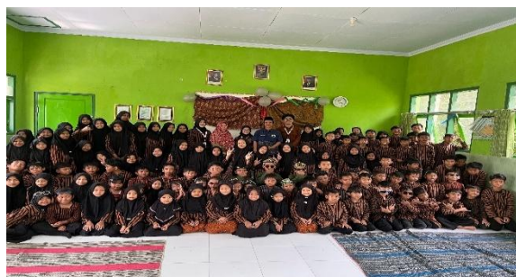
Gambar 16. Foto bersama pada puncak kegiatan Gelar Nusantara dan CELENFEST