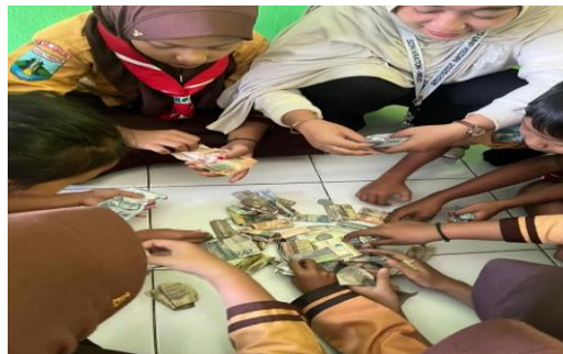
Gambar 3. Peserta didik membuka dan menghitung hasil Tabungan bersama

Setelah celengan selesai dibuat, kegiatan dilanjutkan dengan proses menabung secara rutin yang dilaksanakan selama periode 3 November hingga 4 Desember 2025. Dalam rentang waktu tersebut, peserta didik dibiasakan untuk menyisihkan sebagian uang saku mereka ke dalam celengan, baik secara harian maupun mingguan sesuai kesepakatan kelas. Proses menabung ini didampingi oleh guru dan mahasiswa, sehingga peserta didik tidak hanya menabung, tetapi juga memahami nilai uang, pentingnya konsistensi, serta kebiasaan mengatur keuangan sederhana. Kegiatan ini secara bertahap membentuk sikap disiplin, tanggung jawab, dan kesadaran finansial pada diri peserta didik.