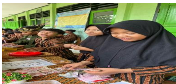
Gambar 15. Kegiatan menghitung hasil penjualan dalam kegiatan CELENFEST

Sebagai penutup rangkaian Gelar Nusantara, peserta didik kelas V menampilkan tarian daerah gugur gunung. Penampilan tari ini disajikan dengan penuh semangat dan penghayatan, memperlihatkan hasil latihan yang telah dilakukan sebelumnya. Gerakan tari yang selaras dengan iringan musik memberikan kesan estetis dan menjadi penutup yang meriah bagi seluruh rangkaian penampilan seni. Penampilan tari ini sekaligus menegaskan pesan utama Gelar Nusantara, yaitu menumbuhkan rasa cinta, bangga, dan tanggung jawab terhadap budaya Indonesia.