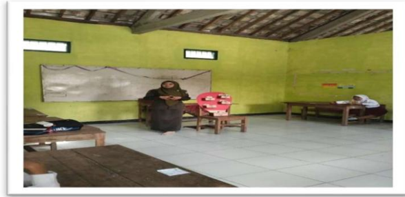
Gambar 2. Pengenalan Media “BUN” pada siswa

Pada tahap ini, pengenalan media “BUN” secara langsung kepada siswa kelas V. Siswa diperkenalkan pada materi, cara menggunakan media, dan implementasi penerapan nilai – nilai norma dalam kehidupan sehari – hari. Media ini dibentuk untuk menumbuhkan karakter dan etika yang baik.