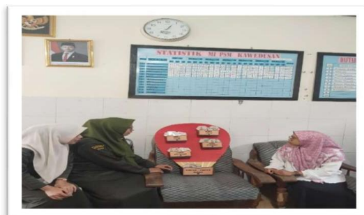
Gambar 1. Sosialisasi Media “BUN” pada Guru dan Siswa Kelas V

Pelaksanaan kegiatan pemanfaatan barang bekas untuk membuat media “BUN” sebagai perantara untuk membentuk karakter siswa. Program ini menghasilkan capaian positif yang terlihat dari keterlibatan guru dan siswa pada kelas V setiap tahapan kegiatan dan etika siswa yang semakin membaik. Secara umum, implementasi program ini memberikan dampak yang penting dan bermakna terhadap peningkatan nilai moral dan pemahaman siswa terhadap materi “BUN”. Gambar berikut memperlihatkan proses pelaksanaan kegiatan pada siswa MI PSM Kawedusan.