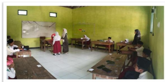
Gambar 3. Praktik Penggunaan Media “BUN”

Pada tahap ini, pengenalan media “BUN” secara langsung kepada siswa kelas V. Siswa diperkenalkan pada materi, cara menggunakan media, dan implementasi penerapan nilai – nilai norma dalam kehidupan sehari – hari. Media ini dibentuk untuk menumbuhkan karakter dan etika yang baik.