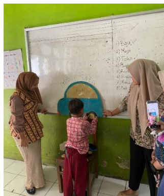
Gambar 2. Pendampingan Siswa