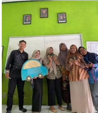
Gambar 3. Dokumentasi Kelompok