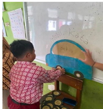
Gambar 1. Pengaplikasian Media MOKA

Secara keseluruhan, hasil dan luaran kegiatan pengabdian menunjukkan bahwa media MOKA berpotensi besar untuk terus dikembangkan sebagai inovasi pembelajaran literasi awal di sekolah dasar. Media ini tidak hanya membantu pencapaian kemampuan membaca dan menulis, namun memperkaya pengalaman belajar siswa melalui kegiatan yang interaktif, kreatif, dan berfaedah. Dengan demikian, penerapan media MOKA mampu mewujudkan model yang bervariasi dalam pembelajaran literasi permulaan yang dapat direplikasi pada konteks pembelajaran lain maupun sekolah lain yang memiliki kebutuhan serupa.