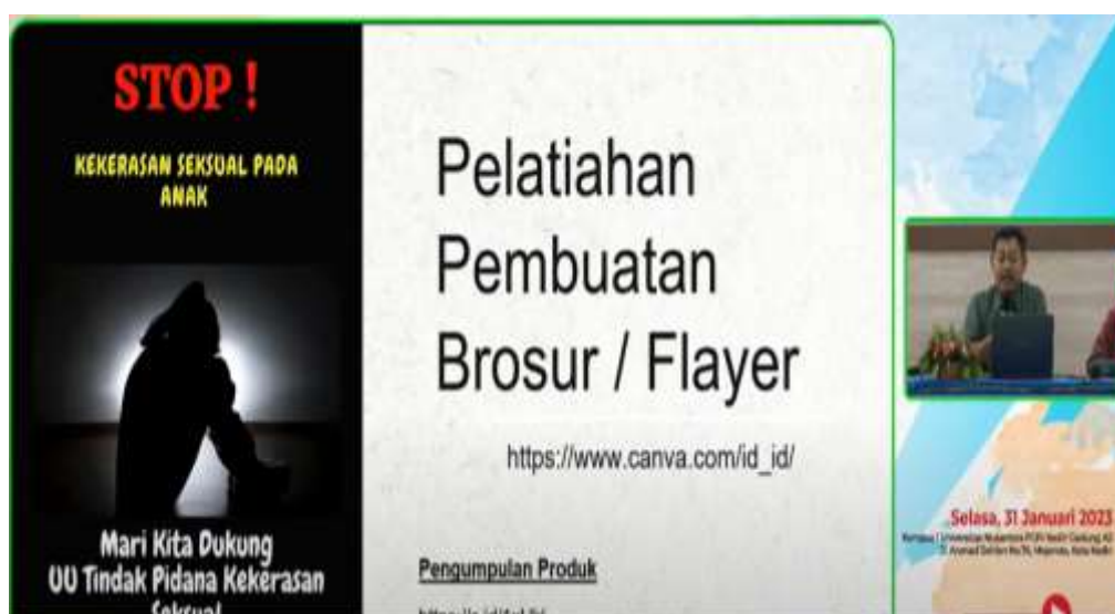
Gambar 4 Pemateri Presentasi

Dari sisi peserta, peserta memerhatikan dan mempraktikkan pembuatan flyer sesuai arahan dan instruksi dari pemateri. Peserta luring yang mengalami permasalahan penggunaan teknologi mendapatkan bantuan dari tim pengabdian. Selain itu, peserta diberi arahan secara bertahap dan waktu yang cukup.