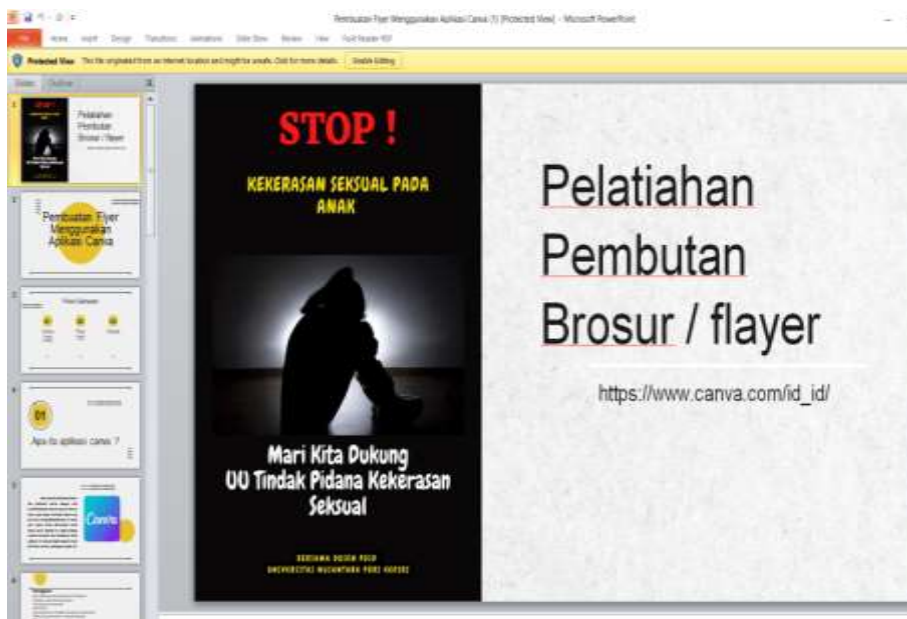
Gambar 3 Tampilan PPT