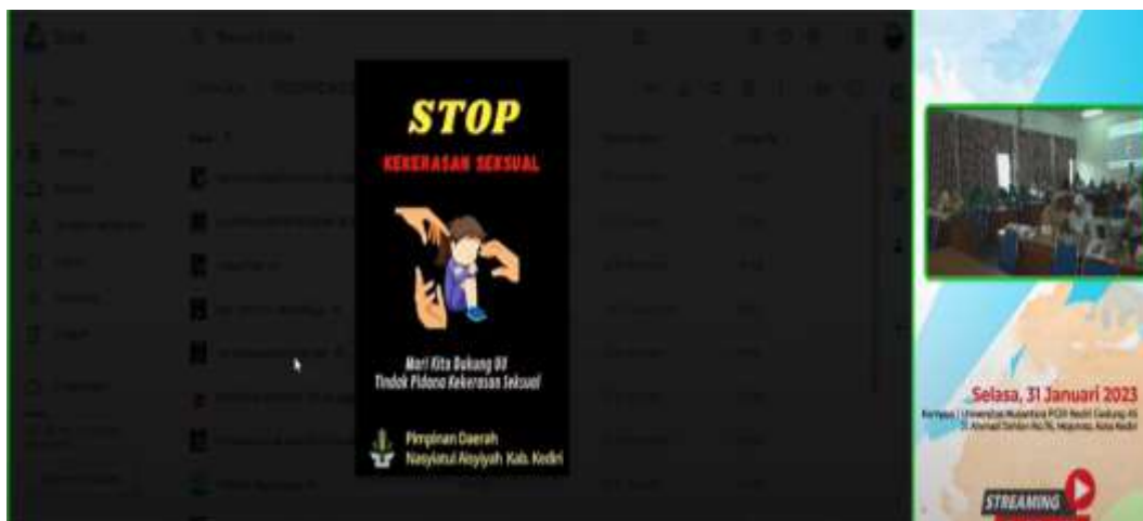
Gambar 5 Peserta Menyimak Materi