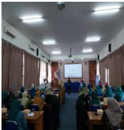
Gambar 1 Peserta Luring

Kediri diikuti oleh 30 guru SD. Pelaksanaan secara daring melalui Streaming Youtube link https://youtu.be/ere5ozP6mSA diikuti oleh 323 mahasiswa. Pelaksanaan dibatasi secara luring untuk memaksimalkan pelatihan untuk guru dan ruangan yang terbatas. Berbeda, dengan secara daring yang diikuti oleh mahasiswa dengan alasan mahasiswa bisa langsung praktik menggunakan laptop dari mana pun.