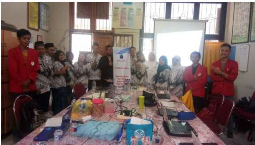
Gambar 3. Foto bersama setelah kegiatan pengabdian