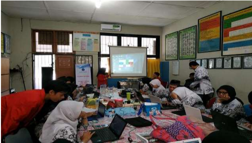
Gambar 2. Pelaksanaan kegiatan