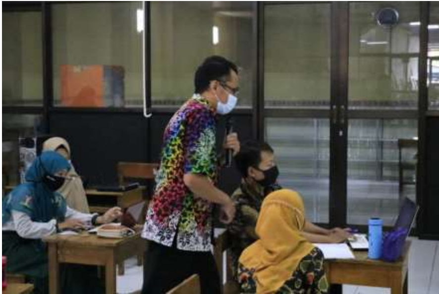
Gambar 3 : Mendampingi guru-guru membuat media pembelajaran

Dari media pembelajaran yang dibuat oleh guru-guru narasumber meminta beberapa guru untuk mempresentasikan hasil yang sudah dibuat, Narasumber mendampingi, memandu dan mengarahkan serta memberikan solusi apabila timbul permasalahan selama penugasan praktik.