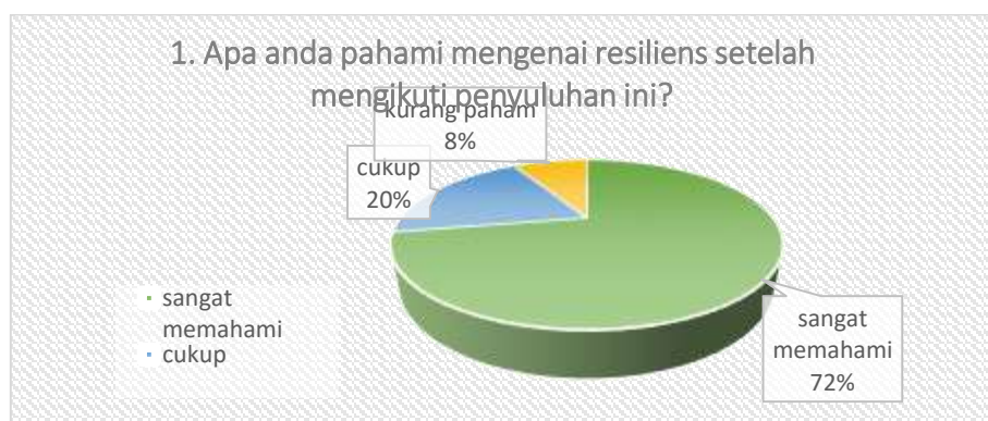
Gambar 1. Data hasil pertanyaan pertama

Angket kedua yang diisi setelah para orang tua wali murid mengikuti penyuluhan memperoleh data dari beberapa pertanyaan yang telah diajukan dalam angket. Data hasil angket kedua digambarkan dalam diagram lingkaran berikut ini