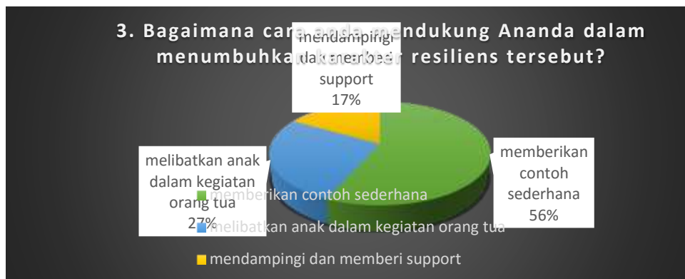
Gambar 3. Data Hasil Pertanyaan Ketiga

Berdasarkan pertanyaan nomer 2 diketahui bahwa sebagian besar anak-anak wali murid masih membutuhkan banyak latihan lagi agar lebih memahami dan mendalami dengan baik dan benar mengenai karakter resiliens. Karakter resiliens sebenarnya ada dalam individu masing-masing. Hanya saja perlu dipertajam dan dipahami lagi agar bisa mengerti karakter resiliens dengan baik. Latihan untuk menumbuhkan karakter resiliens misalnya melalui mainan yang disukai, melibatkan anak dalam pekerjaan orang tua, memberikan contoh sederhana dan nyata agar siswa mudah memahaminya (Nur 2013). Peran orang tua sangat besar dalam melatih anak-anak mereka agar karakter resiliens tertanam dengan baik.