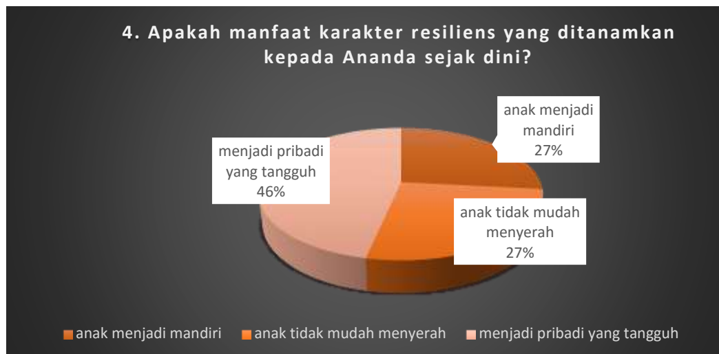
Gambar 4. Data hasil pertanyaan keempat

Berdasarkan data pertanyaan nomer 4 diketahui bahwa terdapat manfaat menanamkan karakter resiliens sejak dini. Menurut responden sekitar 46% menyatakan manfaatnya adalah anak memiliki pribadi yang tangguh, 27% menyatakan anak menjadi mandiri dan 27% menyatakan anak memiliki sikap tidak mudah menyerah. Membiasakan anak untuk dapat memiliki karakter resiliens yang Tangguh memang tidak mudah. Butuh proses dalam pembentukannya. Proses tersebut harus dimulai sejak dini agar anak dapat membangun pondasi hidup dengan kuat (WATI 2017). Dukungan orang tua sangat berperan besar dalam perkembangan anak. Oleh sebab itu orang tua diharapkan senantiasa mendampingi dan terus memotivasi anak agar selalu dapat berperilaku kearah yang positif (Novianti 2018a).