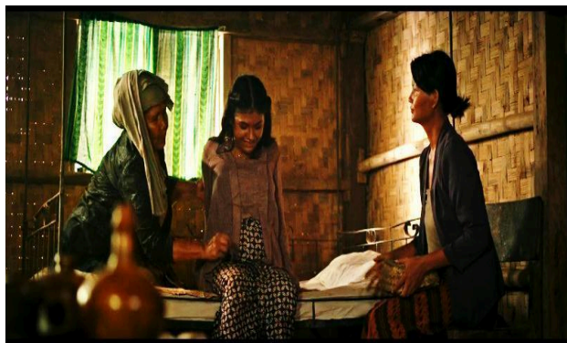
Gambar 2 Pakaian Adat

Ngapak merupakan salah satu jenis gaya bangunan rumah khas Sunda, yang dalam bahasa Indonesia Julang Ngapak berarti burung yang mengepakkan sayapnya. Istilah Julang Ngapak sudah dikenal oleh masyarakat Sunda sejak beberapa waktu lampau. Bentuk atap Julang Ngapak adalah bentuk atap yang melebar di kedua bidang sisinya menyerupai sayap dari burung julang yang sedang merentangkan sayapnya.