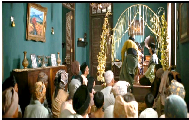
Gambar 1 Janur

Data non verbal pada film Bayi Ajaib dapat dijabarkan sebagai berikut.