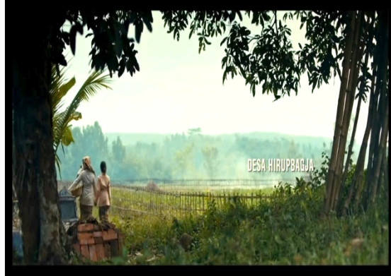
Gambar 1 Kabut

Berdasarkan gambar 1 atas, kabut termasuk indeks. Kabut adalah fenomena atmosfer yang terjadi saat uap air mengembun di udara dalam bentuk tetesan air. Kabut seringkali mengurangi jarak pandang secara signifikan karena partikel-partikel di udara menghalangi cahaya. Kabut ini terbentuk ketika udara yang jenuh dengan uap air mendingin hingga titik embunnya berubah menjadi cairan.