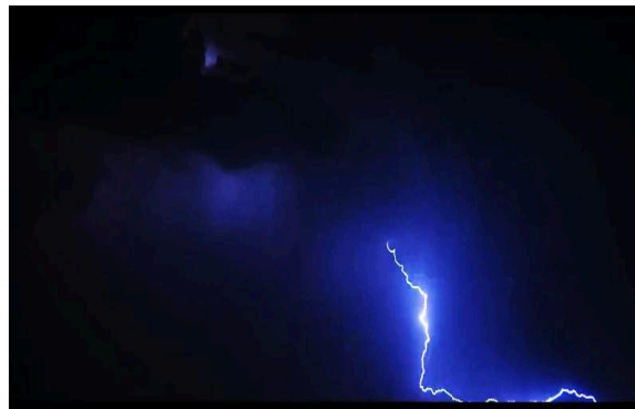
Gambar 2 Petir

Berdasarkan gambar 1 atas, kabut termasuk indeks. Kabut adalah fenomena atmosfer yang terjadi saat uap air mengembun di udara dalam bentuk tetesan air. Kabut seringkali mengurangi jarak pandang secara signifikan karena partikel-partikel di udara menghalangi cahaya. Kabut ini terbentuk ketika udara yang jenuh dengan uap air mendingin hingga titik embunnya berubah menjadi cairan.