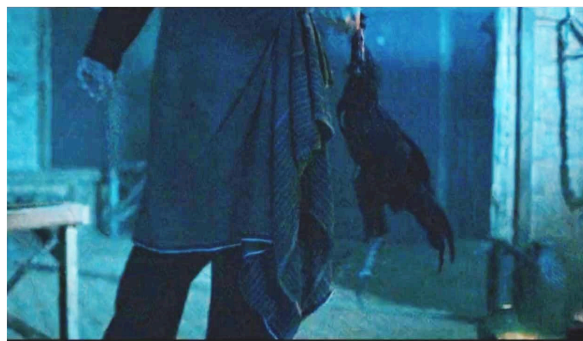
Gambar 4 Ayam Cemani

Berdasarkan gambar 3 di atas sajen merupakan simbol. Sajen adalah sebuah persembahan yang diberikan oleh manusia kepada leluhurnya. Sajen memiliki simbolisme dan makna yang mendalam dalam budaya Jawa. Setiap elem dalam suatu persembahan, seperti dupa, bunga, buah atau makanan, mempunyai arti tertentu dan memiliki kekuatan spiritual untuk membawa perlindungan atau berkah. Gambar di atas adalah sebuah ritual persembahan yang dilakukan Dorman untuk memanggil arwah Albert Dominique.