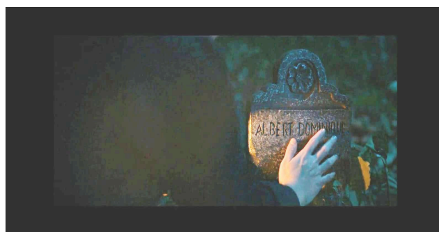
Gambar 2 Batu Nisan

Berdasarkan gambar 1 di atas, janur merupakan simbol. Janur sering digunakan sebagai hiasan dalam berbagai upacara adat Jawa seperti pernikahan, khitanan dan upacara adat lainnya. Dalam kepercayaan Jawa, daun kelapa sering dianggap sebagai simbol kesejahteraan, kebahagiaan dan kesuburan. Pada gambar di atas Kosim dan Laras menggelar acara khitanannya Didi dengan meriah. Acara ini dihadiri oleh banyak warga desa. Di dalam rumah mereka juga dihiasi janur yang menandakan adanya acara khitanan.