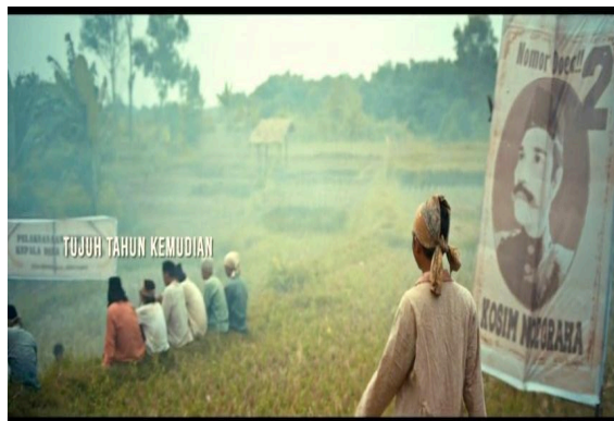
Gambar 3 Baliho

Berdasarkan gambar 2 di atas pakaian adat masyarakat Jawa termasuk ikon. Baju adat atau pakaian adat merupakan salah satu nilai budaya Indonesia yang keberadaannya banyak mendapat pujian dari negara-negara di dunia, (Dita Apriliyani dkk., 2023). Pakaian adat Jawa mempunyai keindahan dan keunikan tersendiri. Saat Laras memeriksakan kandungannya ke dukun bayi, Laras mengenakan pakaian kebaya dan jarik. Tidak hanya Laras saja yang menggunakan pakaian kebaya, gambar di atas juga nampak mak Atik dan Heti juga mengenakan pakainan yang sama. Jarik adalah sejenis kain panjang yang digunakan sebagai sarung oleh pria maupun wanita di Jawa. Jarik seringkali diikat dan dililitkan dengan berbagai macam teknik yang berbeda-beda tergantung pada kesempatan dan status sosial pemakainya.