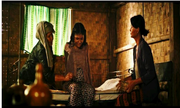
Gambar 2 Pakaian Adat

Ngapak merupakan salah satu jenis gaya bangunan rumah khas Sunda, yang dalam bahasa Indonesia Julang Ngapak berarti burung yang mengepakkan sayapnya. Istilah Julang Ngapak sudah dikenal oleh masyarakat Sunda sejak beberapa waktu lampau. Bentuk atap Julang Ngapak adalah bentuk atap yang melebar di kedua bidang sisinya menyerupai sayap dari burung julang yang sedang merentangkan sayapnya.