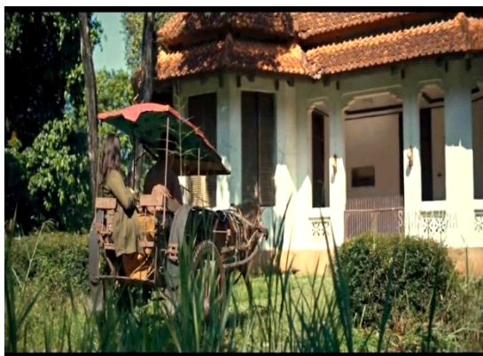
Gambar 1 Rumah Julang Ngapak