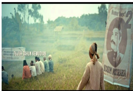
Gambar 3 Baliho

Berdasarkan gambar 2 di atas pakaian adat masyarakat Jawa termasuk ikon. Baju adat atau pakaian adat merupakan salah satu nilai budaya Indonesia yang keberadaannya banyak mendapat pujian dari negara-negara di dunia, (Dita Apriliyani dkk., 2023). Pakaian adat Jawa mempunyai keindahan dan keunikan tersendiri. Saat Laras memeriksakan kandungannya ke dukun bayi, Laras mengenakan pakaian kebaya dan jarik. Tidak hanya Laras saja yang menggunakan pakaian kebaya, gambar di atas juga nampak mak Atik dan Heti juga mengenakan pakainan yang sama. Jarik adalah sejenis kain panjang yang digunakan sebagai sarung oleh pria maupun wanita di Jawa. Jarik seringkali diikat dan dililitkan dengan berbagai macam teknik yang berbeda-beda tergantung pada kesempatan dan status sosial pemakainya.