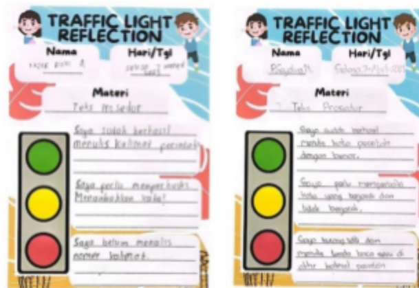
Gambar 3 Refleksi Hasil Pembelajaran

Pada lembar refleksi hasil pembelajaran, peserta didik menuliskan keberhasilannya dalam menulis teks prosedur sesuai kaidah pada bagian warna hijau. Sedangkan pada bagian warna kuning, peserta didik menulis hal-hal yang perlu diperhatikan kembali saat menulis teks prosedur seperti tata kalimat. Sedangkan pada bagian warna merah, peserta didik menuliskan hal-hal yang perlu dihentikan atau hal-hal yang belum ada pada tulisan teks prosedurnya. Sebagai contoh yaitu belum adanya nomor urutan prosedur dan kesalahan tanda baca.