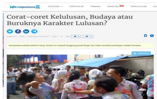
Gambar 2. Berita Daring Budaya Corat-Coret

Berdasarkan hal tersebut di atas, maka dirasa perlu untuk dilakukan sebuah penelitian terkait dengan tradisi corat-coret