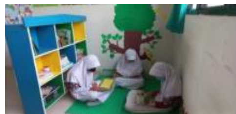
Gambar 3. Pojok Membaca

Pemerintah dalam hal Dinas Pendidikan melalui surat edarannya untuk mengumumkan kelulusan melalui daring (Surat Edaran Dinas Pendidikan DKI Jakarta, 2023). Hal itu untuk mencegah dan mengantisipasi agar peserta didik tidak melakukan kegiatan berkumpul, corat-coret, konvoi kendaraan, dan bentuk lain yang akan mengganggu ketertiban umum.