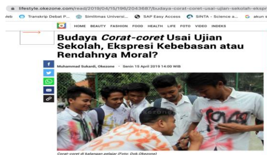
Gambar 1. Berita Daring Budaya Corat- Coret

Tradisi corat-coret ini dapat dikatakan masih sering terjadi hingga saat ini. 2018 pada berita yang termuat dalam jurnal asia memberitakan “Corat-coret baju seragam