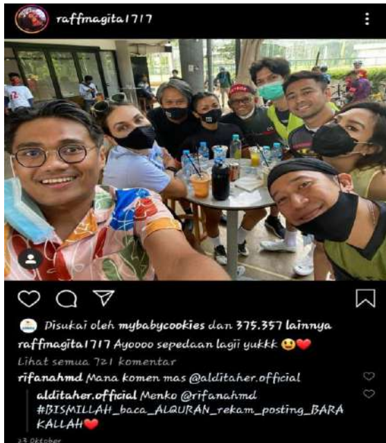
Gambar 10. Temuan Kesalahan Penggunaan Afiksasi