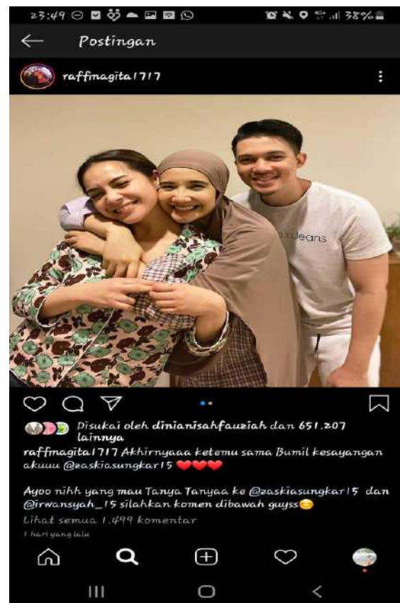
Gambar 9. Temuan Kesalahan Penggunaan Afiksasi