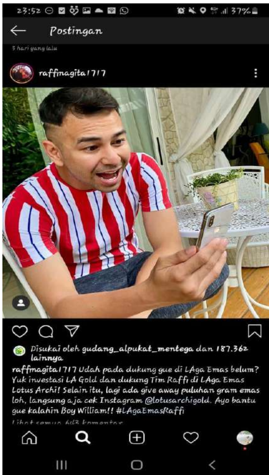
Gambar 8. Temuan Kesalahan Penggunaan Afiksasi dan Reduplikasi Seluruh

Perbaikan : Penggunaan prefiks ber- pada kata dasar temu sehingga menjadi bertemu. Penulisan reduplikasi seluruh pada kata tanya-tanya seharusnya bertanya-tanya mendapat prefiks ber- pada reduplikasi seluruh karena maknanya adalah memberikan atau mengajukan pertanyaan lebih dari satu.