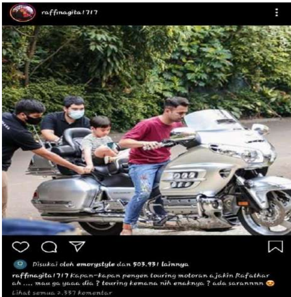
Gambar 3. Temuan Kesalahan Penggunaan Sufiks