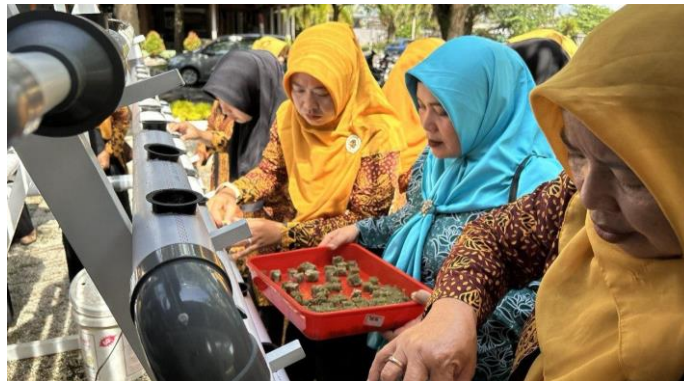
Gambar 3. Praktek penanaman hidroponik menggunakan sistem NFT

diperlukan oleh tanaman hidroponik dan cara mencampur larutan nutrisi dengan proporsi yang tepat untuk memastikan tanaman mendapatkan nutrisi yang optimal (Fauzi et al., 2021).