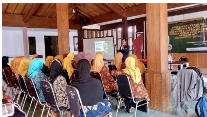
Gambar 2. Kegiatan sosialisasi

Sistem monitoring IoT juga diperkenalkan untuk memantau kondisi tanaman secara real-time. Sistem ini memungkinkan pemantauan pH, suhu, dan kadar nutrisi dalam larutan secara otomatis melalui sensor yang terhubung ke perangkat IoT (Endryanto & Khomariah, 2023). Dengan adanya sistem ini, diharapkan proses perawatan tanaman menjadi lebih mudah serta dapat meningkatkan hasil panen. Selama sosialisasi, warga desa menunjukkan antusiasme yang tinggi dan minat yang besar terhadap teknologi ini. Mereka menyadari bahwa penerapan teknologi hidroponik dan IoT dapat menjadi solusi untuk meningkatkan produktivitas pertanian di desa mereka. Demonstrasi langsung tentang cara kerja sistem hidroponik NFT dan monitoring IoT juga diberikan, sehingga warga dapat melihat secara langsung manfaat dan kemudahan yang ditawarkan oleh teknologi ini.