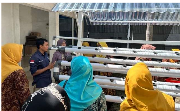
Gambar 4. Kegiatan pendampingan

Kegiatan monitoring dan evaluasi dilakukan setelah keseluruhan kegiatan telah selesai. Monitoring dilakukan 2 bulan setelah kegiatan pendampingan. Menurut Kabonga (2019), monitoring merupakan kegiatan pengumpulan informasi tentang aktivitas yang telah dilakukan sedangkan evaluasi merupakan penilaian secara berkesinambungan dari aktivitas yang telah dilaksanakan. Hasil dari monitoring dan evaluasi mengenai kegiatan PKM teknologi hidroponik dengan metode NFT memberikan gambaran bahwa terdapat peningkatan pengetahuan dan ketrampilan Masyarakat dalam mengelola hidroponik sedangkan untuk peningkatan kesejahteraan Masyarakat belum terlihat secara signifikan.