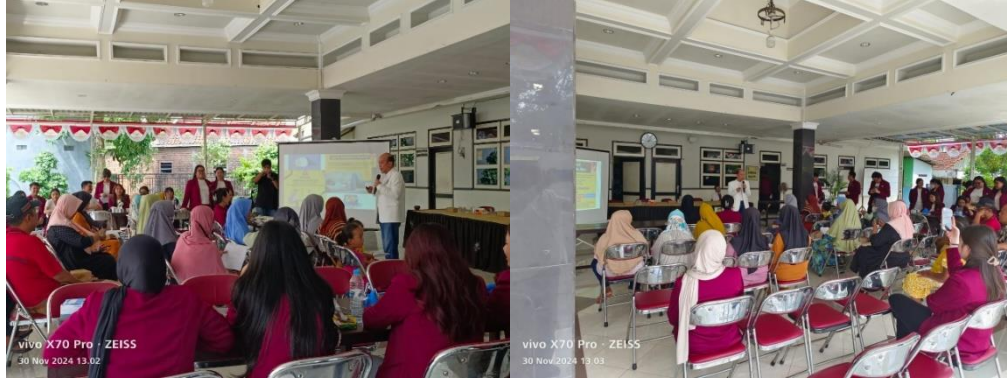
Gambar 2. Pelaksanaan Kegiatan Pengabdian Masyarakat

mendasari kerusakan jaringan sendi. Selain itu, olahraga teratur meningkatkan sensitivitas insulin dan mengurangi akumulasi lemak visceral, dua faktor yang secara tidak langsung berkontribusi pada penurunan produksi asam urat melalui peningkatan metabolisme purin.