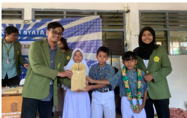
Gambar 2. Penyerahan hadiah Pemenang Lomba Matematika