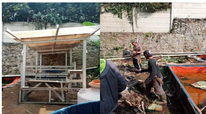
Gambar 4. Pembangunan kandang Maggot secara gotong royong

Pembuatan kandang Maggot yang terletak di lokasi agak jauh dari perumahan warga, dilakukan secara gotong royong dengan dukungan dari tim PKM Polban. Kandang dibuat berukuran 40 m 2 di atas lahan seluas 100 m 2 .