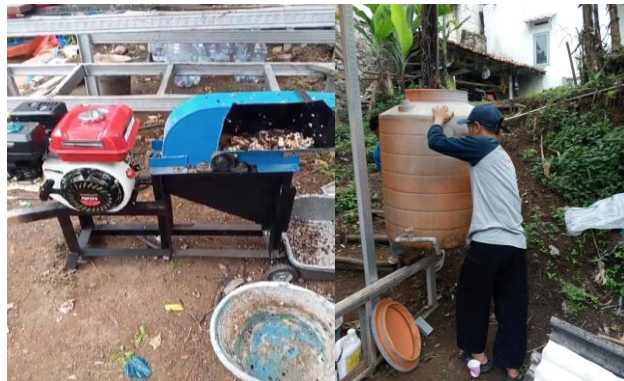
Gambar 5. Mesin pencacah sampah organik dan Tandon air untuk budi daya Maggot

dan geli memegang Maggot, namun jika melihat kandungan protein dari Maggot sangat banyak sekali manfaatnya.