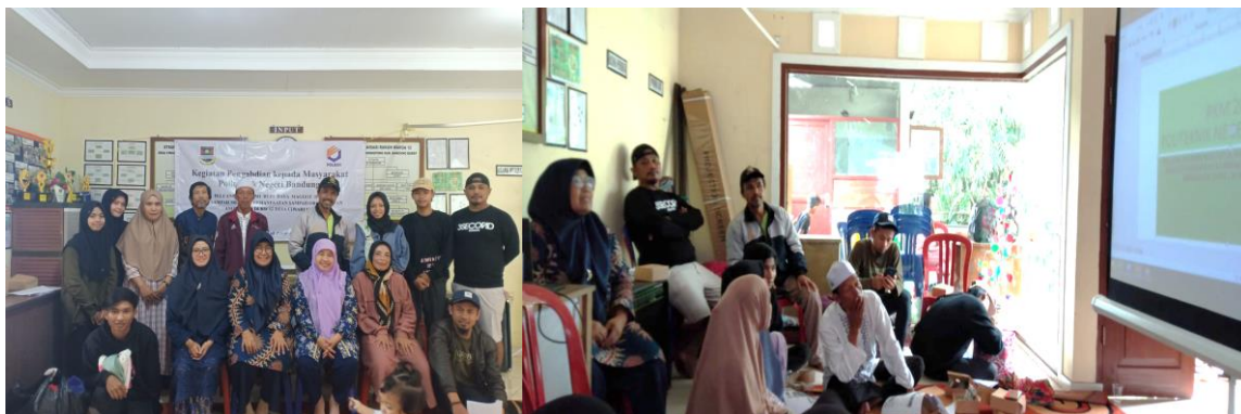
Gambar 3. Sosialisasi Pemilahan Sampah, dan Edukasi Budi daya Maggot

mengenai Maggot secara detail, dimulai dari persiapan pembuatan kandang, perkembangan Maggot dari mulai telur sampai Maggot dewasa, jumlah dan jenis pakan yang dibutuhkan, serta manajemen budi daya Maggot yang dikembangkan menjadi peluang bisnis bagi sebagian masyarakat yang tertarik.