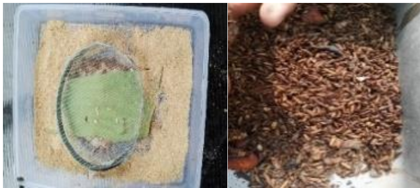
Gambar 2. Budi daya Maggot (skala kecil)

sebagai obat penderita diabetes, dan kandungan minyak maggot dapat dijadikan bahan dasar kosmetika, makanan sisa maggot (Kasgot) dapat dijadikan pupuk dan bahan baku biogas. Maggot merupakan metamorfosis fase kedua setelah fase telur dan sebelum fase pupa, yang kelak menjadi BSF dewasa. Maggot bisa dipanen dari usia 10 hingga 24 hari, yaitu saat telur BSF sudah menetas dan masuk fase larva hingga masuk fase pupa. Maggot mengandung 41-42 persen protein kasar, 31-35 persen ekstrak eter, 14-15 persen abu, 4,18-5,1 persen kalsium, dan 0,60-0,63 persen fosfor dalam bentuk kering (Ramdani et al., 2021). Hal ini dapat menjadi peluang usaha bagi pelaku budi daya maggot jika diproduksi dalam skala yang lebih besar. Budi daya Maggot, selain dapat mengurangi sampah organik, juga membantu mengurangi pencemaran lingkungan. Dan secara tidak langsung, budi daya maggot ini mengurangi jejak metana, jejak karbon, dan membuka lapangan pekerjaan (Dewantoro et al., 2018).