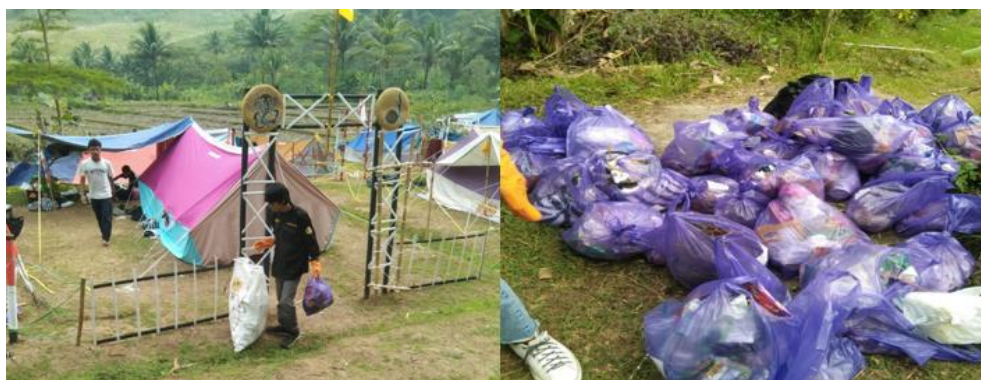
Gambar 2. Kegiatan pengumpulan, penimbangan dan pemilahan timbulan sampah

Pengukuran timbulan sampah dilakukan pada hari kedua perkemahan setelah sampah kegiatan selama 24 jam terkumpul (Badan Standardisasi Nasional, 2002). Pengukuran dilakukan dengan cara penimbangan berat dan pengukuran volume sampah yang dihasilkan (Wardiha et al., 2013). Kegiatan ini dilanjutkan dengan pemilahan dan pengklasifikasian jenis sampah. Kegiatan pengumpulan, penimbangan dan pemilahan timbulan sampah disajikan pada Gambar 2.