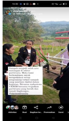
Gambar 3. Postingan kegiatan PkM UKRIM di IG Desa Wisata Tinalah

Hasil yang diperoleh dari kegiatan PkM ini adalah data timbulan sampah akibat kegiatan perkemahan dari SMAN 5 Magelang, SMPN 1 Minggir dan MAN 3 Kalibawang. Perkemahan yang dilaksanakan SMA N 5 Magelang diikuti oleh 276 siswa, 10 orang pembina dan 45 orang panitia pendamping yang terbagi dalam 32 tenda. Perkemahan yang dilakukan oleh SMPN 1 Minggir diikuti oleh 220 orang siswa, 5 orang pembina dan 35 orang panitia pendamping. Kelompok ini terbagi dalam 28 tenda. Perkemahan terakhir dilaksanakan oleh MAN 3 Kalibawang diikuti oleh 108 siswa, 10 orang pembina dan 20 orang panitia pendamping dan terbagi dalam 12 tenda.