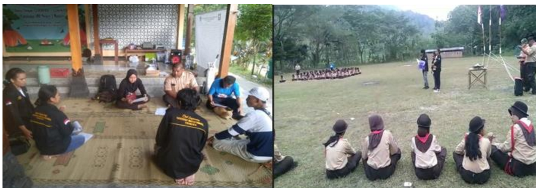
Gambar 1. Penjelasan program kepada pembina pramuka dan peserta perkemahan

perencanaan IPST Desa Wisata Tinalah. Penjelasan program kepada pembina pramuka dan peserta perkemahan dapat dilihat pada Gambar 1.