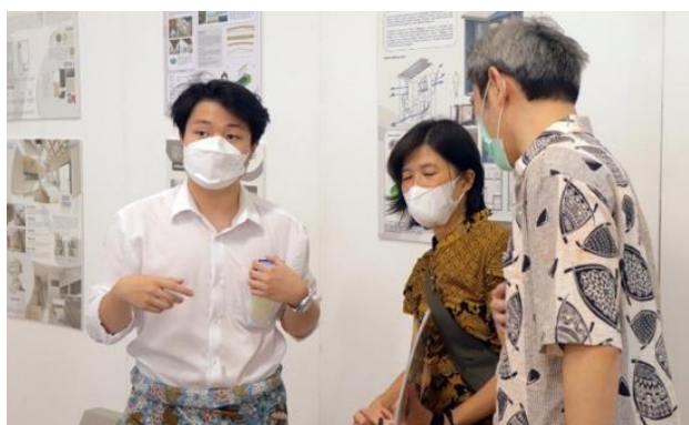
Gambar 1. Proses persiapan pameran dipantau oleh dosen pembimbing

timeline, tampak bahwa luaran pengabdian ini dihasilkan melalui pengerjaan proyek rutin maupun insidental, seperti diantaranya: 1) relawan pengajar pada kelas Budi Pekerti; 2-4) screening awal, akhir serta relawan pada penyelenggaraan baksos kesehatan; 5) tindak lanjut perawatan baksos kesehatan yang telah terselenggara; 6) pembagian sembako dan donor darah; 7) sosialisasi celengan cinta kasih sebagai bagian dari misi amal; (8) pelatihan relawan; dan 9) kunjungan kasih.