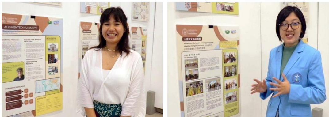
Gambar 3. Mahasiswa mempresentasikan kegiatan Augmented Humanity

Melalui dua contoh di atas, maka dapat diketahui bahwa fleksibilitas menanggapi proyek kemanusiaan dapat optimal apabila setiap pihak dapat secara terbuka menyelami urgensi kebutuhan masyarakat agar dapat diabdikan, termasuk didalamnya bersedia membuka wawasan terhadap kemungkinan pengerjaan proyek kemanusiaan yang memerlukan kompetensi di luar capaian pembelajaran mata kuliah kontekstual. Lebih lanjut adanya evaluasi dari, dan terhadap NGO yang menjadi mitra universitas juga perlu dilakukan, sehingga universitas dapat mengukur baik kuantitas maupun kualitas proyek yang dikerjakan. Hal selaras juga dinyatakan dalam penelitian lain yang menekankan esensi dan implementasi konsep merdeka belajar ini masih perlu dimengerti secara utuh (Satyawati et al., 2022).