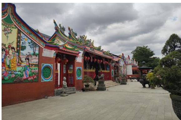
Gambar 3. Kegiatan kunjungan dan observasi ke Vihara Buddha Gaya.

Observasi Altar (Tempat Ibadah) Vihara Buddha Gaya. Pada kegiatan ini, perwakilan dosen bersama dengan mahasiswa melakukan observasi pada Vihara Buddha Gaya seperti pada gambar 3. Kegiatan ini bertujuan untuk mensurvei lokasi pengambilan gambar, bereksperimen dalam pengambilan gambar beserta perkiraan posisi pemimpin kebaktian, test pengambilan gambar, mengukur jarak pengambilan gambar beserta dengan cakupan kamera dan mengukur pencahayaan yang dibutuhkan dengan fasilitas yang tersedia.