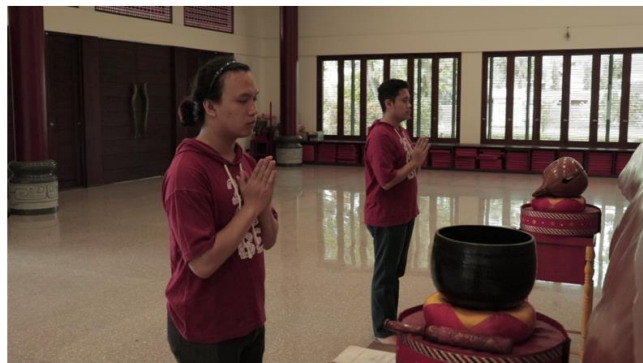
Gambar 7. Tampilan kamera 3

Kamera 3 menggunakan kamera Canon EOS 800D menggunakan lensa kit 18-55 mm. Kamera ini menjadi alternatif kamera yang baik dalam pengambilan gambar. Dikarenakan hasilnya baik untuk dapat dinikmati. Maksud dari penempatan kamera ini adalah memberikan gambaran jelas dari gerak tubuh pemimpin kebaktian khususnya pemegang alat kebaktian Ta Ching. Pemegang alat kebaktian ini sekaligus menjadi pemimpin kebaktian utama dalam pelaksanaan kebaktian. Sehingga dengan menaruh posisi kamera ini dapat menggambarkan kegiatan memimpin kebaktian dengan lebih jelas. Hasil pengambilan gambar pada kamera 3 ditunjukkan pada gambar 7.