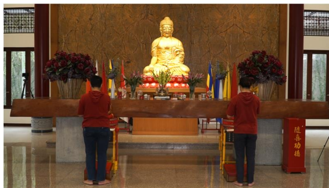
Gambar 6. Tampilan kamera 2

Kamera 3 menggunakan kamera Canon EOS 800D menggunakan lensa kit 18-55 mm. Kamera ini menjadi alternatif kamera yang baik dalam pengambilan gambar. Dikarenakan hasilnya baik untuk dapat dinikmati. Maksud dari penempatan kamera ini adalah memberikan gambaran jelas dari gerak tubuh pemimpin kebaktian khususnya pemegang alat kebaktian Ta Ching. Pemegang alat kebaktian ini sekaligus menjadi pemimpin kebaktian utama dalam pelaksanaan kebaktian. Sehingga dengan menaruh posisi kamera ini dapat menggambarkan kegiatan memimpin kebaktian dengan lebih jelas. Hasil pengambilan gambar pada kamera 3 ditunjukkan pada gambar 7.