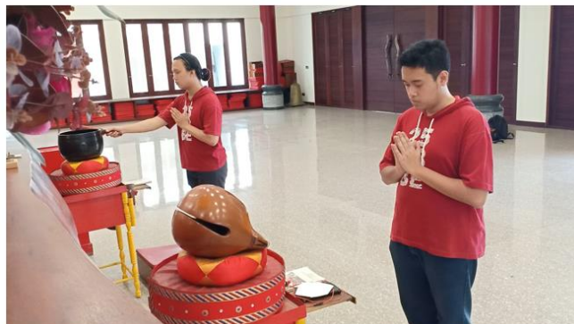
Gambar 5. Tampilan kamera 1.

Kamera 1 menggunakan handphone Oppo F9. Hal ini digunakan untuk membandingkan kualitas video sekaligus menjadi alternatif pengambilan gambar di kemudian hari. Selama pengambilan gambar berlangsung, kamera pada handphone Oppo F9 mengalami auto focus yang membuat kejernihan gambar berubah-ubah. Sehingga untuk lebih baik di kemudian hari, jika memungkinkan, auto focus pada kamera handphone dapat di non-aktifkan atau menggunakan mode yang lain. Pengambilan gambar pada kamera 1 memberikan gambaran jelas pemimpin kebaktian dengan posisi pemegang alat kebaktian Mu Yi. Hasil pengambilan gambar pada kamera 1 ditunjukkan pada gambar 5.