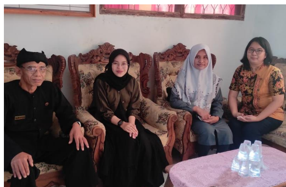
Gambar 1. Tim Pengabdian wawancara dengan Guru dan Kepala SMP Kosgoro