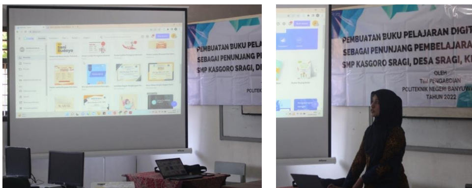
Gambar 2. Pengenalan Platform Canva

Pada kegiatan hari kedua adalah ceramah dengan materi pengenalan platform yang akan digunakan yaitu Canva , mulai dari membuat akun, log in , fitur-fitur, resources , mengubah dan mewarnai tulisan, dan upload video. Dokumentasi kegiatan dapat dilihat pada Gambar 2. Sebelumnya peserta diberikan soal pretest yang berkaitan dengan Canva . Untuk kegiatan selanjutnya peserta diminta untuk menyiapkan bahan atau materi pelajaran yang akan digunakan untuk pendampingan dan pembuatan buku pelajaran digital berbasis Canva .