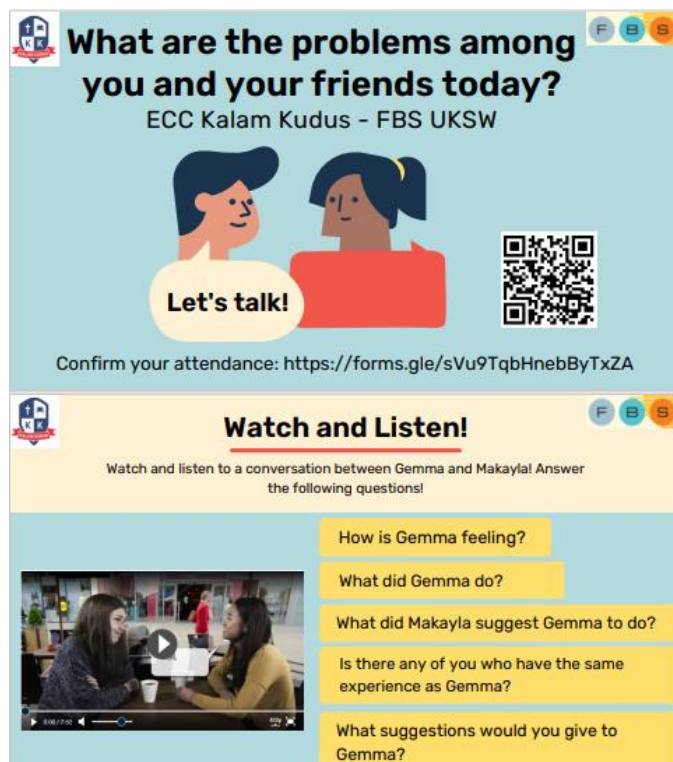
Gambar 1: Kegiatan Pembuka pada Pertemuan 5 (Tanggal 4 Maret 2022)

Sesi latihan merupakan kegiatan inti, dimana siswa berlatih berbicara dalam Bahasa Inggris secara intensif sesuai topik di tiap pertemuan. Pada sesi ini, peserta dan para speaking buddies berlatih bersama dalam kelompok kecil dengan fitur breakout room di Zoom . Tiap kelompok kecil terdiri dari satu orang speaking buddies dengan tiga hingga empat siswa (Gambar 2). Selanjutnya, kegiatan penutup dilakukan untuk menyampaikan kesimpulan dan mereview poin-poin penting pada pertemuan tersebut. Kegiatan penutup ini dipandu kembali oleh dosen instruktur.