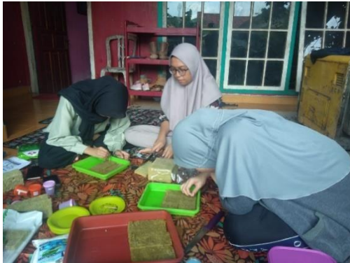
Gambar 4. Penyemaian Benih Tanaman

Menurut beberapa studi, jenis tanaman pakcoi, selada, dan kangkong merupakan beberapa conroh tanaman yang cocok menggunakan metode hidroponik (Primasari, 2021). Selain itu, dipelajari pula beberapa teknik budidaya hidroponik seperti cara mengatur vitamin A dan B, kebutuhan cahaya tanaman, dan mengatur PH pada air pada sistem hidroponik. Gambar 4 menunjukkan proses penyemaian benih pada media tanam, sedangkan Gambar 5 menunjukkan proses pengaturan PH air.