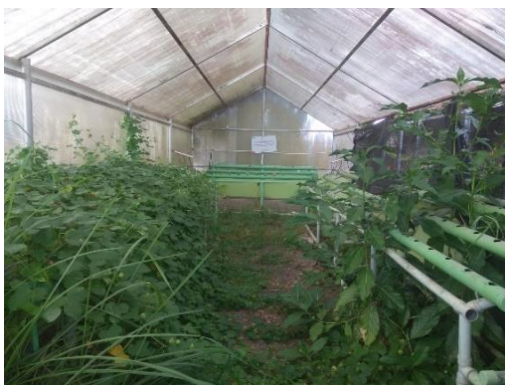
Gambar 2. Kondisi Greenhouse Sebelum dibersihkan

Berdasarkan tujuan proyek, tim pengabdian masyarakat telah melakukan beberapa hal pada lokasi pemberdayaan berupa pembuatan rumah hidroponik, pelatihan hidroponik, hingga pemasaran sayuran hidroponik. Pembuatan rumah hidroponik dimulai dengan membersihkan greenhouse terbengkalai yang ada di Lorong Karang Anyar Plaju Darat. Gambar 2 menunjukkan kondisi greenhouse sebelum dibersihkan. Gambar 3 menunjukkan kondisi greenhouse setelah dibersihkan.