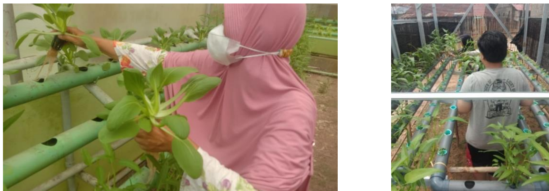
Gambar 7. Pemeriksaan dan Perawatan Tanaman Hidroponik

Tanaman hidrponik yang sudah memenuhi umur, kemudian dipanen. Pada minggu keenam dilakukan kegiatan panen sayur kangkung dengan usia tanam mencapai 3 minggu. Dalam proses panen yang pertama diperoleh hasil panen kangkung sebanyak 3 kg yang selanjutnya dijual dengan harga Rp 10.000 per kilo.