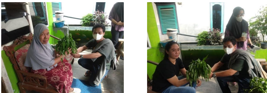
Gambar 9. Pemasaran Sayuran Hidroponik Kepada Warga Karang Anyar

Pada minggu ketujuh, dilakukan pemanenan sayuran pakcoi dan selada. Hasil panen, diperoleh pakcoi seberat 1,5 kg yang dijual seharga Rp 30.000 dan selada diperoleh dengan berat 0,5 kg yang dijual seharga Rp 15.000. Dari pemasaran kangkung, pakcoi, dan selada, diperoleh pendapatan sebesar Rp 75.000 dengan modal sebesar Rp 60.000. Sehingga diperoleh keuntungan sebesar 25% dari bahan baku. Setelah dilakukan proses pemanenan, pada minggu