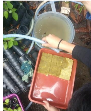
Gambar 5. Pengaturan PH Air

Kegiatan tersebut menghasilkan benih siap tanam pada umur satu minggu. Kegiatan selanjutnya dilakukan dengan bekerja sama dengan Ibu-Ibu PKK daerah Plaju Darat yaitu pelatihan penyemaian benih baru tanaman berupa benih pakcoi dan penanaman pada pipa hidroponik. Dalam pelatihan juga dijelaskan mengenai cara pembuatan dan perawatan hidroponik. Gambar 6 menunjukkan pelatihan bersama ibu-ibu PKK Plaju Darat. Pelatihan ini dihadiri oleh 20 orang Ibu-Ibu PKK daerah Plaju Darat.