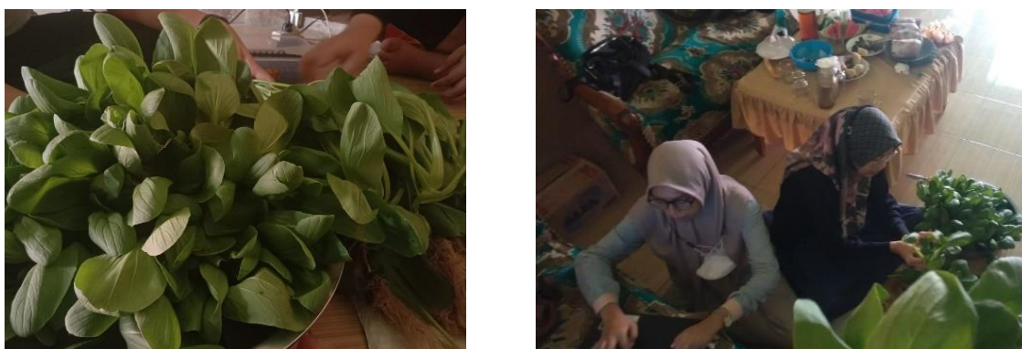
Gambar 8. Proses Panen Pakcoi

Tanaman hidrponik yang sudah memenuhi umur, kemudian dipanen. Pada minggu keenam dilakukan kegiatan panen sayur kangkung dengan usia tanam mencapai 3 minggu. Dalam proses panen yang pertama diperoleh hasil panen kangkung sebanyak 3 kg yang selanjutnya dijual dengan harga Rp 10.000 per kilo.