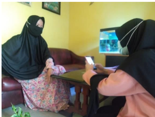
Gambar 1. Survei Kepada Ibu-Ibu PKK Plaju Darat

kedelapan dilakukan survei terhadap kepuasan program sistem budidaya tanaman dengan hidroponik terhadap Ibu-Ibu PKK daerah Karang Anyar, Plaju Darat, Palembang untuk mengetahui bagaimana dampak dari program serta mengetahui evaluasi yang dapat dilakukan.