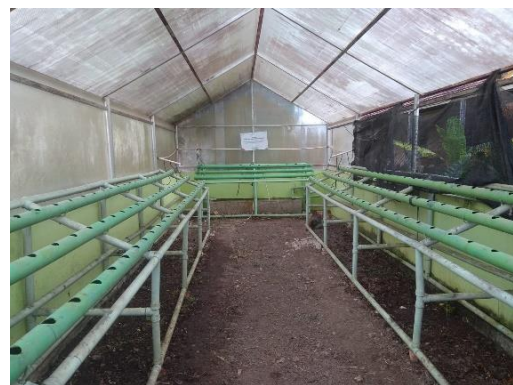
Gambar 3. Kondisi Greenhouse Setelah Dibersihkan

Setelah itu, tim pelaksana dan mitra melakukan penyemaian bibit yang dilakukan bersama dengan salah satu Ibu PKK Plaju yaitu Bude Roos Mianalita. Dalam kesempatan ini mitra belajar cara menyemai tanaman hidroponik berupa pakcoi, selada, dan kangkung.