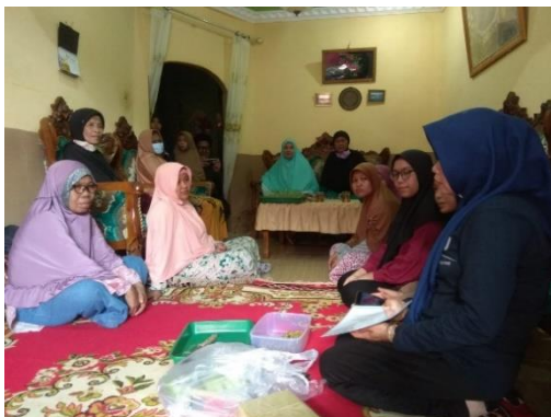
Gambar 6. Pelatihan Hidroponik Bersama Ibu-Ibu PKK Plaju Darat

Kegiatan tersebut menghasilkan benih siap tanam pada umur satu minggu. Kegiatan selanjutnya dilakukan dengan bekerja sama dengan Ibu-Ibu PKK daerah Plaju Darat yaitu pelatihan penyemaian benih baru tanaman berupa benih pakcoi dan penanaman pada pipa hidroponik. Dalam pelatihan juga dijelaskan mengenai cara pembuatan dan perawatan hidroponik. Gambar 6 menunjukkan pelatihan bersama ibu-ibu PKK Plaju Darat. Pelatihan ini dihadiri oleh 20 orang Ibu-Ibu PKK daerah Plaju Darat.