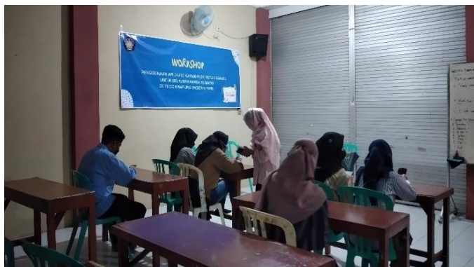
Gambar 2. Pendampingan instalasi kamus elektronik Bahasa

Pelaksanaan pengabdian kepada masyarakat ini memberikan manfaat kepada khalayak sasaran yang dibuktikan bahwa para tutor dapat memanfaatkan kamus elektronik Bahasa yang dijadikan sebagai media pembelajaran. Selain itu, dengan adanya pelaksanaan pengabdian kepada masyarakat ini kepada para tutor di EECC Kampung Inggris Pare dapat memberikan dampak yang signifikan baik secara kognitif maupun psikomotor bagi tutor bahasa Inggris dan pembelajar yang sedang belajar Bahasa Inggris dengan memanfaatkannya kamus elektronik Bahasa yang berbasis android di handphone mereka saat proses pembelajaran. Pelaksanaan program pengabdian kepada masyarakat ini juga dapat memberikan pengetahuan untuk meningkatkan pengajaran dalam hal penggunaan media berbasis IT dan memudahkan mereka dalam hal pencarian alternatif media selain book dictionary atau kamus dalam bentuk buku.