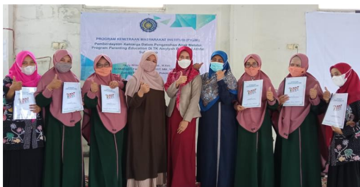
Gambar 4. Tim pengabdian dan guru TK Aisyiyah setelah kegiatan pelatihan

Tindak lanjut yang akan dilakukan setelah pelatihan ini yaitu dengan mengaplikasikannya kepada anak didik yang akan didampingi oleh tim pengabdian dan akan dilakukan rutin setiap 6 bulan untuk mengevaluasi dan memantau perkembangan anak.