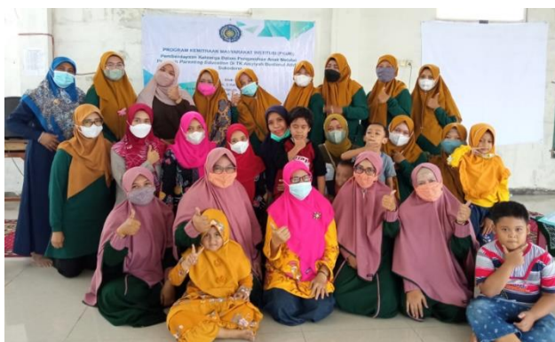
Gambar 3. Tim pengabdi dan wali murid TK Aisyiyah setelah kegiatan parenting education

Berdasarkan gambar diatas dapat diketahui bahwa sebelum mengikuti kegiatan parenting education sebagian besar wali murid (71%) memiliki pengetahuan yang kurang tentang pengasuhan anak, dan setelah mengikuti kegiatan parenting education sebagian besar wali murid (54%) pengetahuan ibu tentang pengasuhan anak menjadi baik. Wali murid mengaku senang dengan kegiatan ini karena dapat menambah wawasan dan ketrampilan mengasuh anak yang penting untuk perkembangan anak.