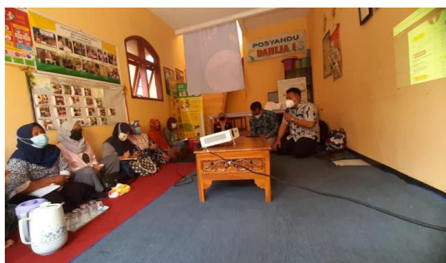
Gambar 5. Penjelasan tentang Digital Marketing

Periode awal 2020 menjadi cambuk bagi perekonomian di dunia secara menyeluruh dan terjadi kelesuan ekonomi akibat dari dampak pandemi Covid-19. Pemanfaatan teknologi di era digital dilakukan sebagai bentuk adaptasi untuk bangkit kembali dan penguatan fundamental ekonomi di berbagai lini dan sektor. Skema perdagangan langsung beralih menjadi pendekatan digitalisasi karena keterbatasan ruang gerak akibat adanya karantina, isolasi, dan self-distancing yang dilakukan oleh masyarakat sehingga kegiatan ekonomi pun terbatas gerak pengembangannya. Melemahnya kegiatan ekonomi memaksa UMKM dan unit usaha perdagangan harus bertahan sedemikian rupa dengan pengembangan ke arah digitalisasi menggunakan strategi pemasaran terpadu yang lebih luas melalui media digital, seperti media sosial dan e-commerce sebagai peluang pemasaran yang baik untuk memasarkan produk yang diinginkan.