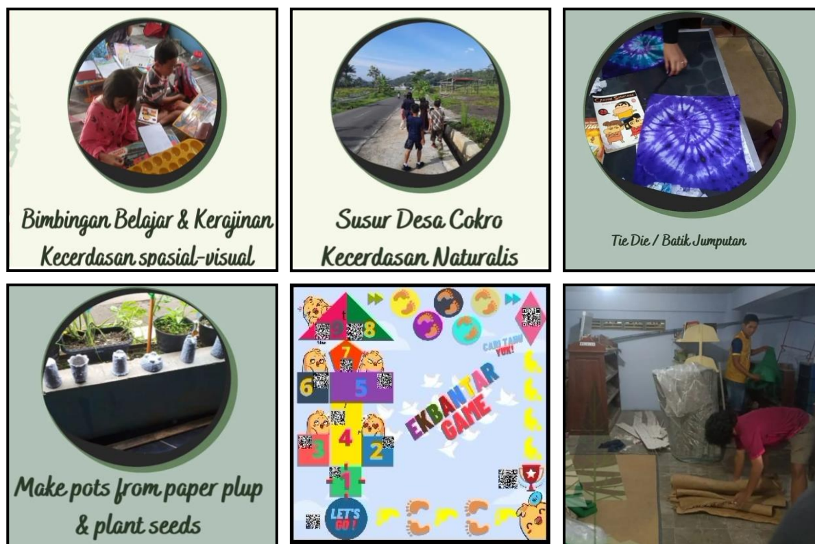
Gambar 2. Kegiatan dan produk Pengabdian rumah baca berbasis Education Sustainable Development

Terbentuknya komunitas literasi serta pengurus rumah baca ini berisi anak-anak taman baca dengan dukungan dari pengurus perpustakaan remaja Cokro. Adapun dokumentasi kegiatan pengabdian sebagai berikut pada Gambar 2.