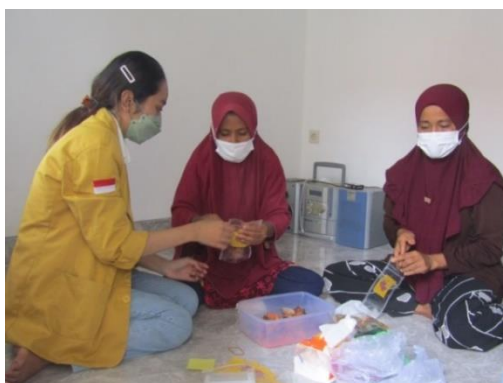
Gambar 4. Pendampingan Ibu-Ibu Rumah Tangga dalam Pengemasan Kerupuk Kulit Ikan

Pada tahap pelaksanaan, pengabdi mulai memberikan bentuk pendampingan serta pelatihan dalam membuat produk olahan kerupuk kulit ikan dengan inovasi baru. Pada hari pertama dan kedua kegiatan, yaitu tanggal 27-28 Januari 2022 bertempat di kediaman Ibu Firmah dan dihadiri oleh sebanyak lima orang ibu rumah tangga, kegiatan diawali dengan pengabdi yang mulai menjelaskan bahan-bahan yang akan dipakai serta tahapan - tahapan dalam proses pembuatan olahan kerupuk kulit ikan dengan inovasi baru.