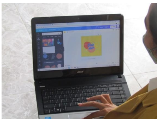
Gambar 5. Pendampingan dan Pelatihan mengenai Pembuatan Logo/ Sticker

Setelah pengabdi menjelaskan mengenai bahan yang akan dipakai dan tahapan-tahapan dalam proses pembuatan olahan kerupuk kulit ikan dengan inovasi baru, pengabdi juga memberikan pendampingan mengenai pengemasan kerupuk kulit ikan dengan kemasan yang baru.