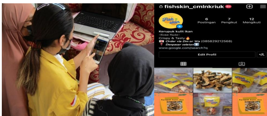
Gambar 7. Pendampingan Pemasaran Produk Melalui Sosial Media dan Instagram

Gambar di atas merupakan hasil design logo yang sudah dicetak menjadi sticker dan sudah ditempelkan pada kemasan kerupuk kulit ikan yang nantinya akan di pasarkan kepada kalangan masyarakat.