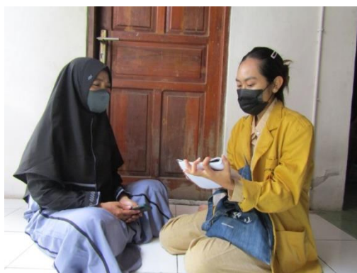
Gambar 2. Tahap Persiapan berupa diskusi kepada Ibu Rumah Tangga

Mengenai hasil pengabdian masyarakat yang telah saya lakukan dengan memberikan kegiatan pendampingan serta pelatihan kepada ibu-ibu rumah tangga setempat, memberikan dampak yang sangat positif karena dengan adanya inovasi baru pada olahan kerupuk kulit ikan berupa penambahan rasa baru seperti balado, hal ini akan menciptakan minat ataupun rasa penasaran masyarakat akan olahan kerupuk kulit ikan dengan rasa yang baru ini. Selain itu, proses pemasaran yang memanfaatkan sosial media seperti Instagram, dimana banyak kalangan masyarakat terutama remaja hingga dewasa yang menggunakan situs sosial media ini. Dengan begitu, produk kerupuk kulit ikan yang dihasilkan oleh ibu-ibu rumah tangga di lingkungan setempat akan dapat dijangkau oleh banyak pembeli. Hasil dari pengabdian yang telah dicapai antara lain: