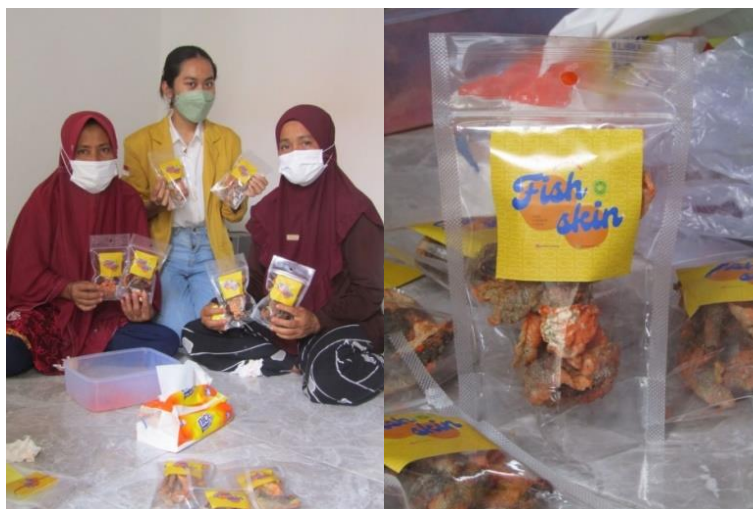
Gambar 8. Hasil dari Pendampingan serta Pelatihan di Kampung Bugis, Desa Serangan

Aspek Pemasaran. Indikator dari aspek pemasaran ini adalah ibu – ibu rumah tangga dapat membuat nama produk serta akun sosial media di Instagram. Jumlah ibu – ibu rumah tangga yang sudah dapat membuat nama produk serta akun sosial media di Instagram yaitu sebanyak 5 orang. Sedangkan sebanyak 4 orang diantaranya telah mendapatkan hasil yang positif dari memasarkan produk olahan kerupuk kulit ikan melalui sosial media berupa Instagram yang dapat dijangkau dengan banyak pembeli. Dengan begitu, saat ini para ibu rumah tangga dapat memanfaatkan akun sosial medianya untuk berjualan.