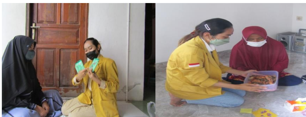
Gambar 3. Pendampingan serta Menjelaskan Bahan untuk Variasi Baru Kerupuk Kulit Ikan

Pada tahap persiapan ini pengabdian melakukan kunjungan pada tanggal 24 Januari 2022 dengan salah satu ibu rumah tangga untuk berdiskusi mengenai kesiapan ibu-ibu rumah tangga atas program kegiatan yang akan dijalankan terkait permasalahan yang ada, serta menetapkan waktu pelaksanaan kegiatan pelatihan dan pendampingan, dan akhirnya disepakati bahwa kegiatan tersebut akan mulai dilaksanakan pada tanggal 27 – 30 Januari 2022 bertempat di kediaman Ibu Firmah.