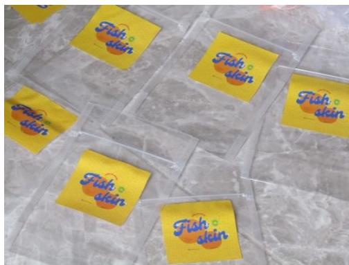
Gambar 6. Logo Kerupuk Kulit Ikan pada Kemasan

Gambar di atas merupakan hasil design logo yang sudah dicetak menjadi sticker dan sudah ditempelkan pada kemasan kerupuk kulit ikan yang nantinya akan di pasarkan kepada kalangan masyarakat.