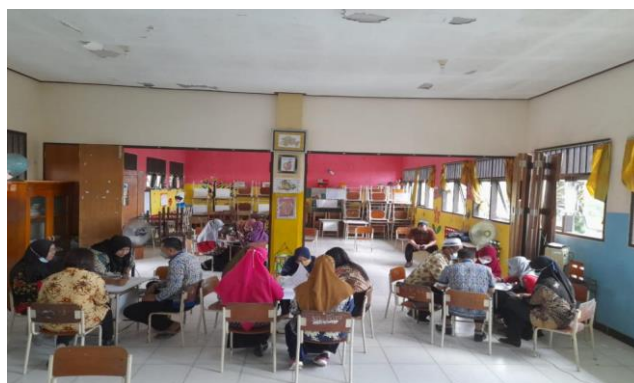
Gambar 4. Pemodelan Pembelajaran SCL

Selanjutnya, pada pertemuan 3 bedah perencanaan ( plan ), pada saat merencanakan pengajaran atau skenario yang akan diperagakan, peserta di minta untuk merumuskan tujuan pembelajaran dengan jelas dan sesuai model pembelajaran SCL yang diterapkan.