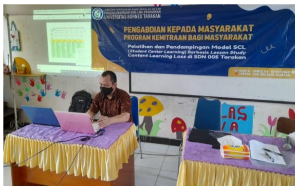
Gambar 6. Umpan Balik dari Peserta SCL

Di akhir kegiatan dari pembelajaran penerapan model SCL mulai dari merencanakan hingga melaksanakan, kami selaku narasumber memaparkan hasil umpan balik dari peserta dan narasumber ( see ) yang dipaparkan secara eksklusif oleh bapak Donna Rhamdan, S.E., M.Pd secara berkelanjutan untuk dapat diperhatikan dalam perbaikannya, baik itu secara konten materi maupun sumber belajar yang digunakan.