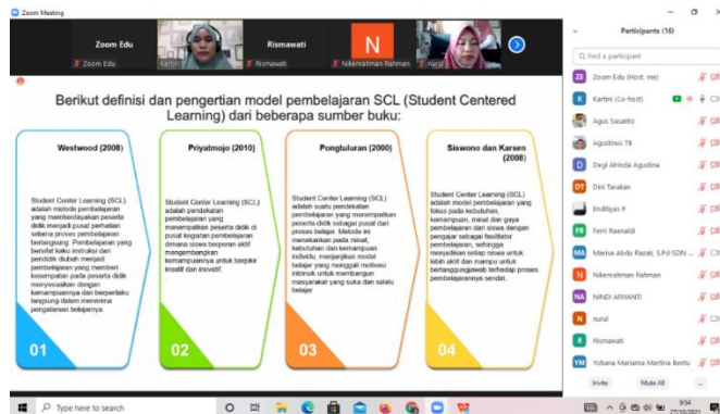
Gambar 2. Penjelasan Materi Secara Online

Di dalam pengenalan model pembelajaran yang berpusat kepada siswa, kami berharap para peserta sudah pernah melaksanakan sebelumnya dan dituangkan ke dalam rencana pelaksanaan pembelajaran agar pengenalan ini sebagai penyegaran bukan tahap awal mengetahui ada model pembelajaran baru.