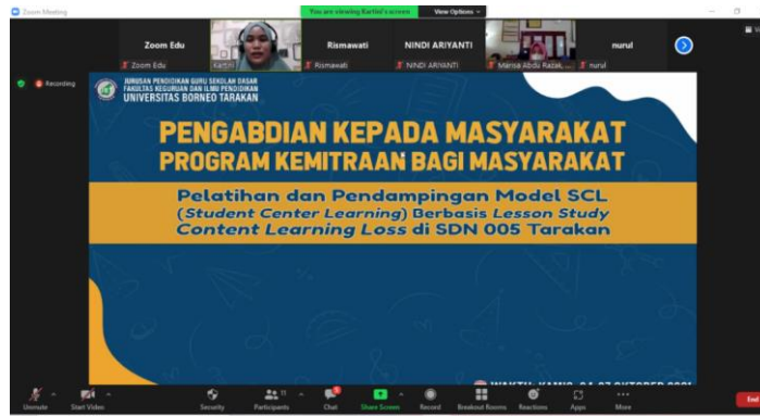
Gambar 1. Webinar Online

Kegiatan pelatihan dan workshop penerapan model student center learning yaitu berpusat pada siswa dan guru sekolah dasar di Kota Tarakan, dimana Kegiatan workshop pada pertemuan pertama diawali dengan penyajian materi secara online oleh ibu Kartini, S.Pd., M.Sc terkait materi pengenalan model SCL kemudian dilanjutkan oleh bapak Suchyo, M.Pd terkait materi media interaktif pembelajaran secara online dan offline .