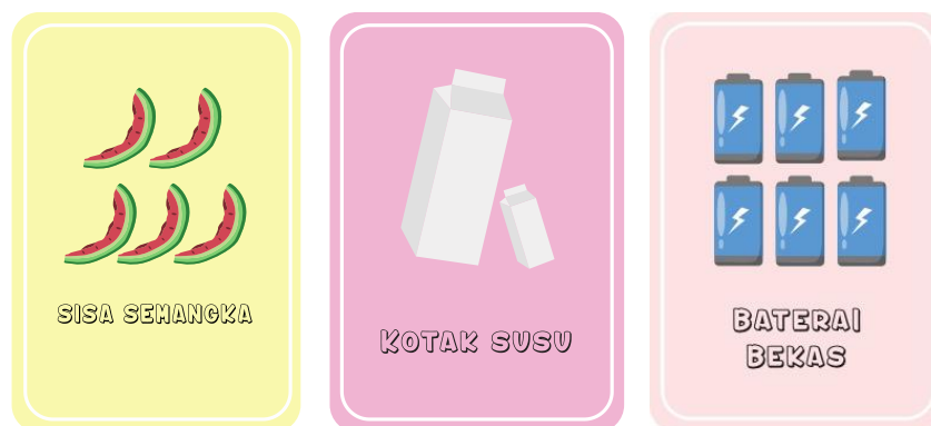
Gambar 1. Desain kartu bergambar pada sampah organik, non organik dan B3

Kedua melakukan koordinasi dengan tim PKM mengenai tugas masing-masing anggota dan apa saja yang perlu dipersiapkan mulai tahap pra produksi, produksi, pasca produksi, pelaksanaan hingga evaluasi. Mulai tahap produksi pada desain 30 flashcard yang menjadi media sosialisasi pilah sampah pada anak-anak PAUD. Tim terlebih dahulu mendesain mulai dari gambar ilustrasi, warna, karakter, hingga tata letak pada kartu bergambar ( flashcard ), selanjutnya menentukan ukuran yang sesuai berdasarkan penggunaan flashcard yang dibagikan kepada anak-anak. Lalu memproses rancang gambar apa saja yang sesuai dengan tema. Pada sisi pertama flashcard akan diberikan gambar ilustrasi jenis sampah pada Gambar 1.