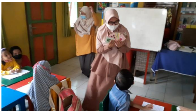
Gambar 3. Tim memberikan penyuluhan tentang pilah sampah

Pelaksanaan pengabdian masyarakat di PAUD didasari karena siswa belum pernah sama sekali mendapatkan penyuluhan tentang pemilahan sampah berdasarkan jenisnya. Penulis melakukan observasi terlebih dahulu kepada pihak sekolah, hanya didapati poster “Buanglah sampah pada tempatnya!” berdasarkan hasil wawancara juga guru menjelaskan bahwa mereka belum mengajarkan life skill pilah sampah kepada siswanya. Maka, tim terlebih dahulu menjelaskan mengenai definisi sampah organik, non organik dan B3. Siswa sangat bersemangat ketika melihat tim pengabdian masyarakat membawa beberapa alat peraga untuk menjelaskan materi. Kartu bergambar yang didesain memang tidak memiliki ukuran yang besar jika dilihat dari depan kelas, namun tim menanggulangnya dengan bantuan guru yang juga memegang kartu untuk menunjukkan gambar apa yang sedang dijelaskan kepada siswa yang duduk di bagian belakang kelas. Terdapat 30 jenis sampah yang telah didesain oleh tim dengan berbagai warna yang mencolok agar terlihat menarik dan menyenangkan ketika dilihat oleh siswa.