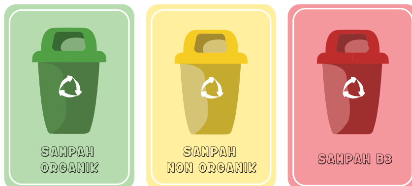
Gambar 2. Desain tempat sampah organik, non organik dan B3

Setelah kelayakan desain diuji, maka akan dilaksanakan kegiatan pengabdian masyarakat yang melibatkan anak-anak PAUD. Kegiatan dilaksanakan secara tatap muka dengan durasi 1.5 jam. 45 menit pertama, tim menjelaskan di papan tulis mengenai deskripsi