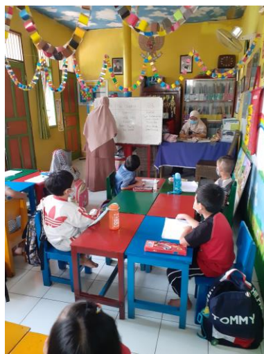
Gambar 4. Tim menuliskan di papan tulis kategorisasi jenis sampah

Penjelasan mengenai kategorisasi 30 jenis sampah ke dalam 3 kelompok tempat sampah yang telah selesai disampaikan oleh tim pengabdian masyarakat seperti pada Gambar 4. Kemudian dilanjutkan dengan flashcard game pilah sampah untuk mengukur peningkatan pengetahuan dan pemahaman siswa. Pada hari Rabu tanggal 3 November 2021 saat pelaksanaan pengabdian masyarakat berlangsung terdapat 13 siswa yang hadir. Maka, tim membagi anak-anak ke dalam 3 kelompok, 2 kelompok berisi 4 siswa, 1 kelompok lainnya berisi 5 siswa.