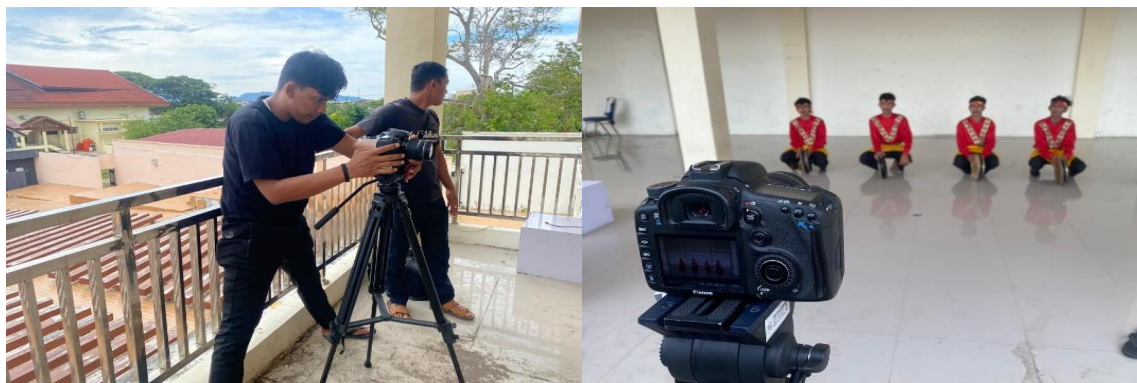
Gambar 6. Proses pengambilan video

Selanjutnya guna mendukung proses penilaian, pengabdian juga menyebarkan angket untuk mendata tingkat pemahaman peserta terhadap wawasan mencipta tari dan musik iringan sebagai refleksi dari kegiatan pengabdian yang dilakukan. Angket diberikan pada peserta dengan melalui link google form .