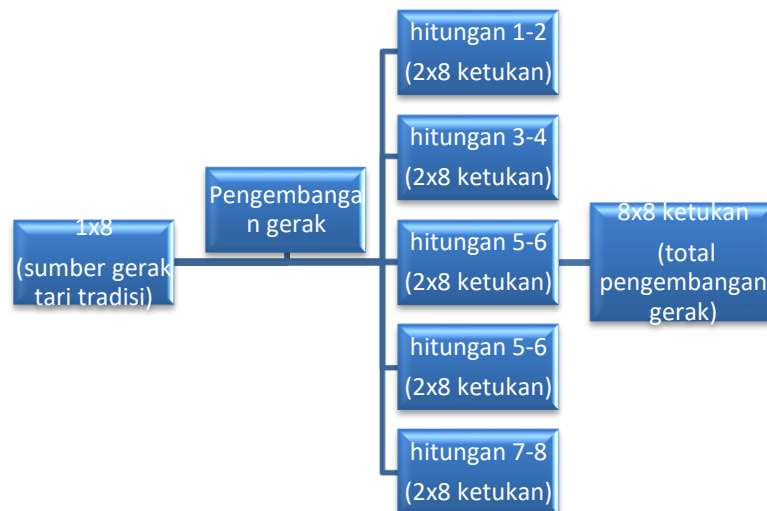
Gambar 4. Alur proses pengembangan gerak yang dilakukan peserta pelatihan

Berdasarkan contoh gerak yang telah di demonstrasikan, peserta diarahkan untuk melakukan praktik mandiri pengembangan gerak. Terlebih dahulu, peserta harus memilih tari tradisi dan pola gerak yang akan dikembangkan dengan jumlah 1x8 ketukan. Sumber pijakan gerak yang berjumlah 1x8 ketukan dikembangkan menjadi rangkaian gerak baru yang berjumlah 8x8 ketukan, dengan ketentuan mengembangkan gerak untuk hitungan 1-2, 3-4, 5-6, dan 7-8 (masing-masing berjumlah 2x8 ketukan).