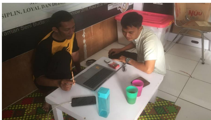
Gambar 2. Observasi dan diskusi bersama pimpinan Lembaga Buana

Anggota pengusul 1 dan 2 bertugas mempersiapkan serta menyusun materi pelatihan sesuai bidang keahlian masing-masing. Proses menyusun materi pelatihan tertulis melibatkan mahasiswa sebagai peraga/model. Setelah draf materi tersusun maka dilakukan evaluasi materi yang melibatkan ketua pengusul guna mencermati isian materi dengan target capaian kegiatan yang diinginkan. Materi pelatihan tertulis didistribusikan kepada mitra sebagai bahan bacaan sebelum dilaksanakannya kegiatan pelatihan.