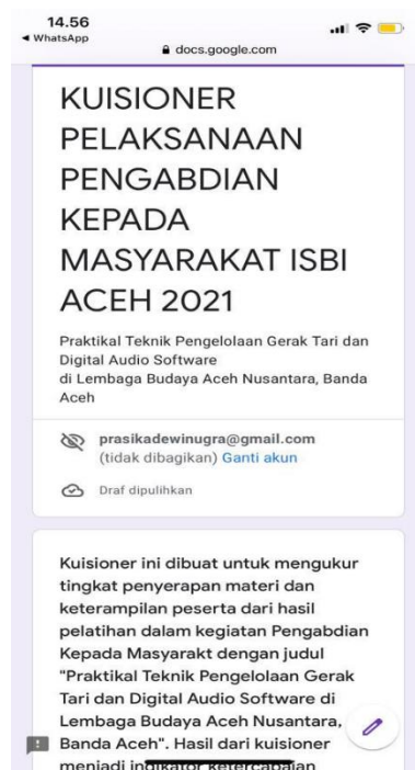
Gambar 7. Kuisisioner evaluasi kegiatan

Selanjutnya guna mendukung proses penilaian, pengabdian juga menyebarkan angket untuk mendata tingkat pemahaman peserta terhadap wawasan mencipta tari dan musik iringan sebagai refleksi dari kegiatan pengabdian yang dilakukan. Angket diberikan pada peserta dengan melalui link google form .