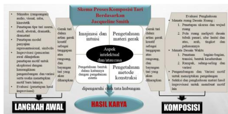
Gambar 1. Skema Pendekatan Koreografi menurut Jacqueline Smith

Pelaksanaan kegiatan menggunakan pendekatan koreografi yang dilakukan oleh Jacqueline Smith dalam buku terjemahan Ben Suharto yang memaparkan metode konstruksi I atau proses awal komposisi tari terdiri atas rangsang tari, tipe tari, perlakuan terhadap bahan untuk membuat gerak tari representasional dan simbolik, improvisasi, seleksi pemula gerak tari (Smith, 1976:20). Kegiatan ini menggabungkan 2 (dua) teknik penyampaian materi yaitu secara teoritik dan mendemonstrasikan secara praktik. Teknik ini dipilih untuk lebih memudahkan penyampaian materi kepada peserta dan mempercepat rangsang kinestetik dalam pengolahan gerak tari dan respon bunyi. Menurut Bambang Sunarto, ilmu penciptaan seni merupakan kumpulan fakta dan berbagai proposisi integral, yang penerapannya bisa saja membawa pengetahuan teoritis ke dalam praktik keterampilan penciptaan seni. Keterampilan berkarya seni dapat terdiri dari keterampilan praktis, keterampilan produktif, dan keterampilan berpikir teoritis (Sunarto, 2015). Metode pelaksanaan kegiatan antara lain : perencanaan ( planning ), pelaksanaan ( acting ), pemantauan ( monitoring atau observing ), penilaian ( reflecting atau evaluating ).