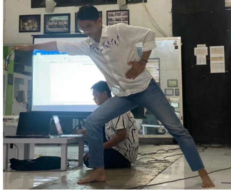
Gambar 3. Demonstrasi gerak oleh peraga pelatihan

Berdasarkan contoh gerak yang telah di demonstrasikan, peserta diarahkan untuk melakukan praktik mandiri pengembangan gerak. Terlebih dahulu, peserta harus memilih tari tradisi dan pola gerak yang akan dikembangkan dengan jumlah 1x8 ketukan. Sumber pijakan gerak yang berjumlah 1x8 ketukan dikembangkan menjadi rangkaian gerak baru yang berjumlah 8x8 ketukan, dengan ketentuan mengembangkan gerak untuk hitungan 1-2, 3-4, 5-6, dan 7-8 (masing-masing berjumlah 2x8 ketukan).